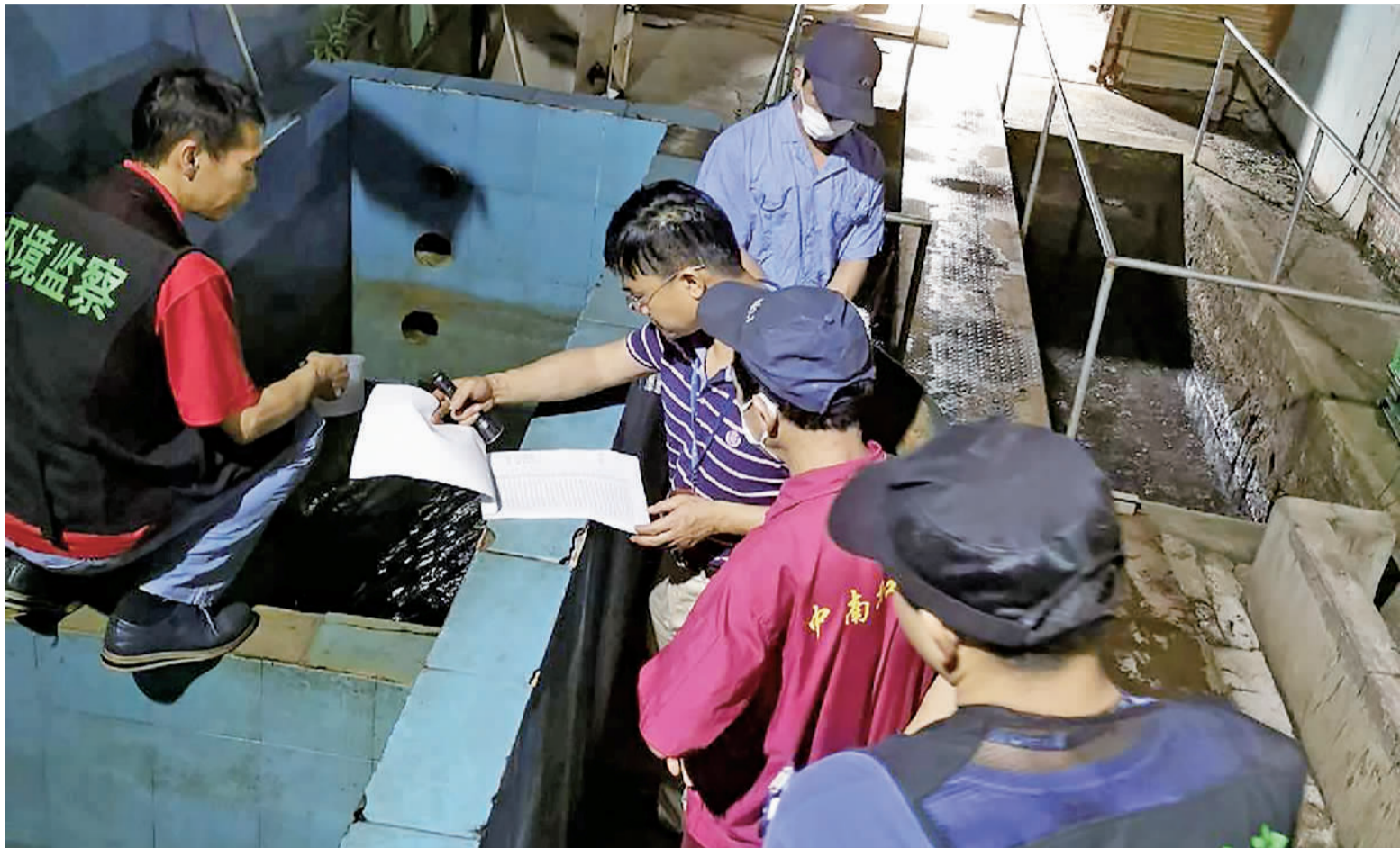
■狮山环保执法人员夜间巡查企业环保情况。

多级联动执法一般会联动公安机关进行线索排查,快速处理涉嫌环境犯罪案件。“今年我们有3宗环境涉刑线索移交公安立案,公安对我们的支持力度很大。”狮山镇环保办相关负责人表示,“有一次我们监测到河涌污染,经排查赶到现场时,犯罪嫌疑人已逃跑。”根据现场查获的一些线索,公安持续追查了2个月,最终在外地将2名犯罪嫌疑人抓获。 法网恢恢,疏而不漏。在多级联动的精准打击下,“生态狮山”建设将迎来新飞跃。