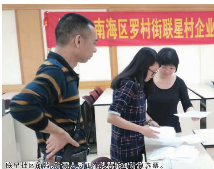
联星社区的监、计票人员正在认真核对计算选票。