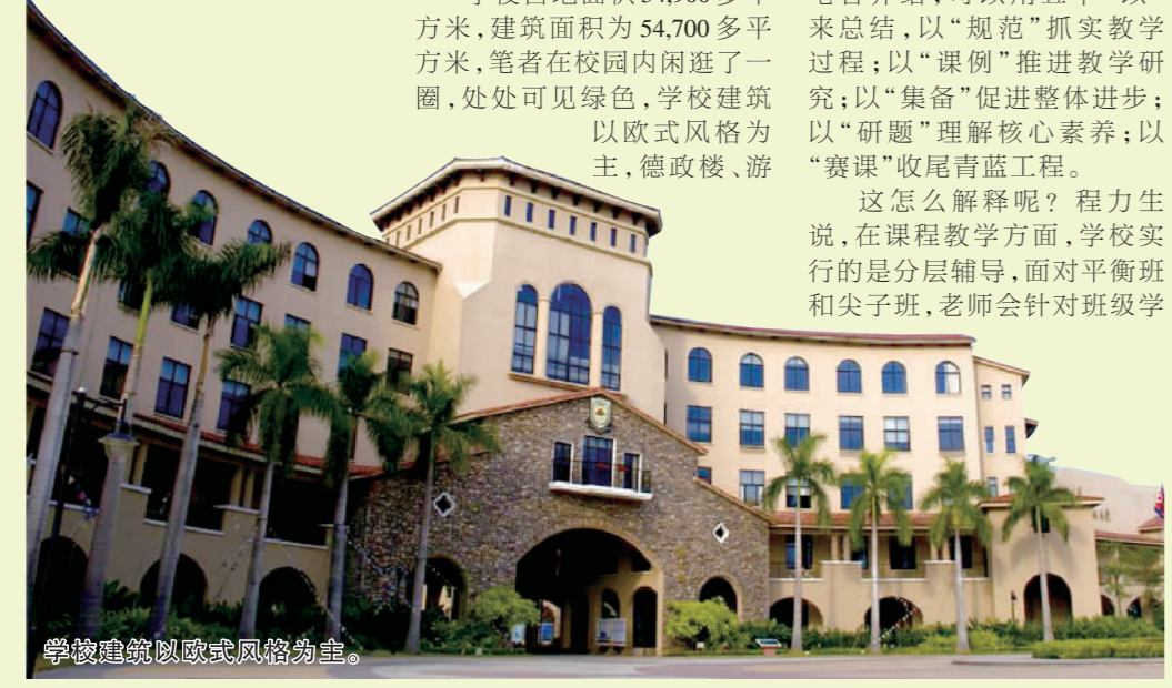
学校建筑以欧式风格为主。

沿着静谧而视野开阔的中信大道,拐角处可见省实南海学校的指示牌,穿过花间小径,感受清风拂面,到达这所远离闹市喧嚣的广东实验中学南海学校,映入眼帘的是学校高耸的欧式钟楼,蓝天白云映衬之下,内心的一丝浮躁也沉静了下来,果真是个读书的好地方。