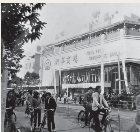
■ 1982年12月，祖庙路上，兴华商场开业。