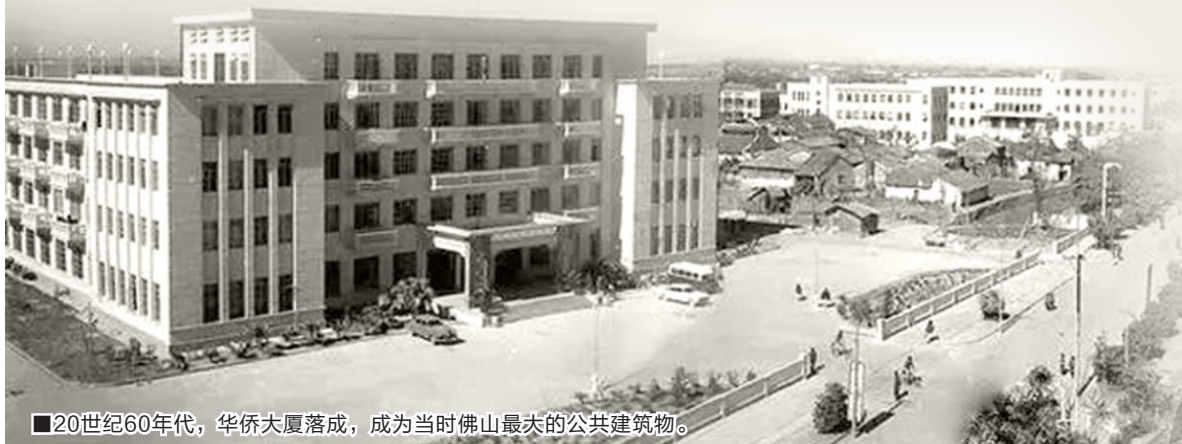
■ 20世纪60年代，华侨大厦落成，成为当时佛山最大的公共建筑物。