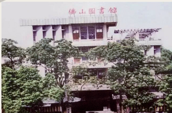
■ 20世纪80年代，位于祖庙路上的佛山图书馆。