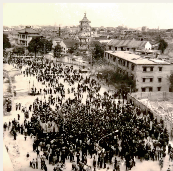
■ 1977年2月，祖庙路的“春节文化街”。

北宋时期祖庙建成后，周边商业逐渐聚集，形成墟市。至明代，这里已经聚集大量手工业者和商人，成为佛山“CBD”。至清代，这里更是李众胜堂保济丸、黄祥华如意油等佛山传统品牌的聚集地。民国时期城市中心迁移至升平片区，祖庙片区发展放缓。