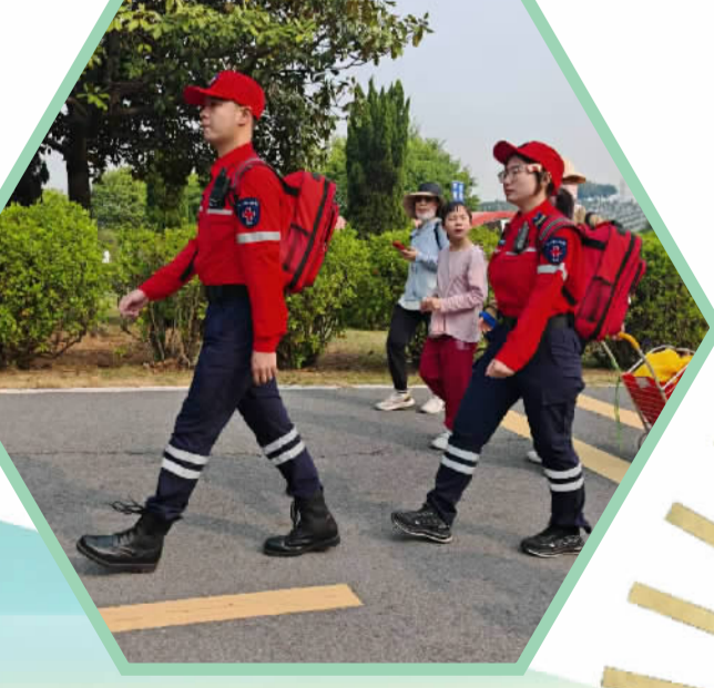
■佛山市红十字519应急救援志愿服务队守护市民祭扫安全。