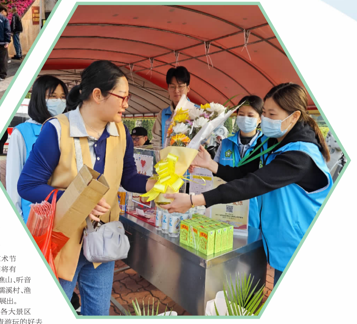
■市民购买鲜花，践行文明祭扫。

记者从南海区民政局获悉，清明假期三天，全区殡仪馆和公墓共接待祭扫群众近80万人次。