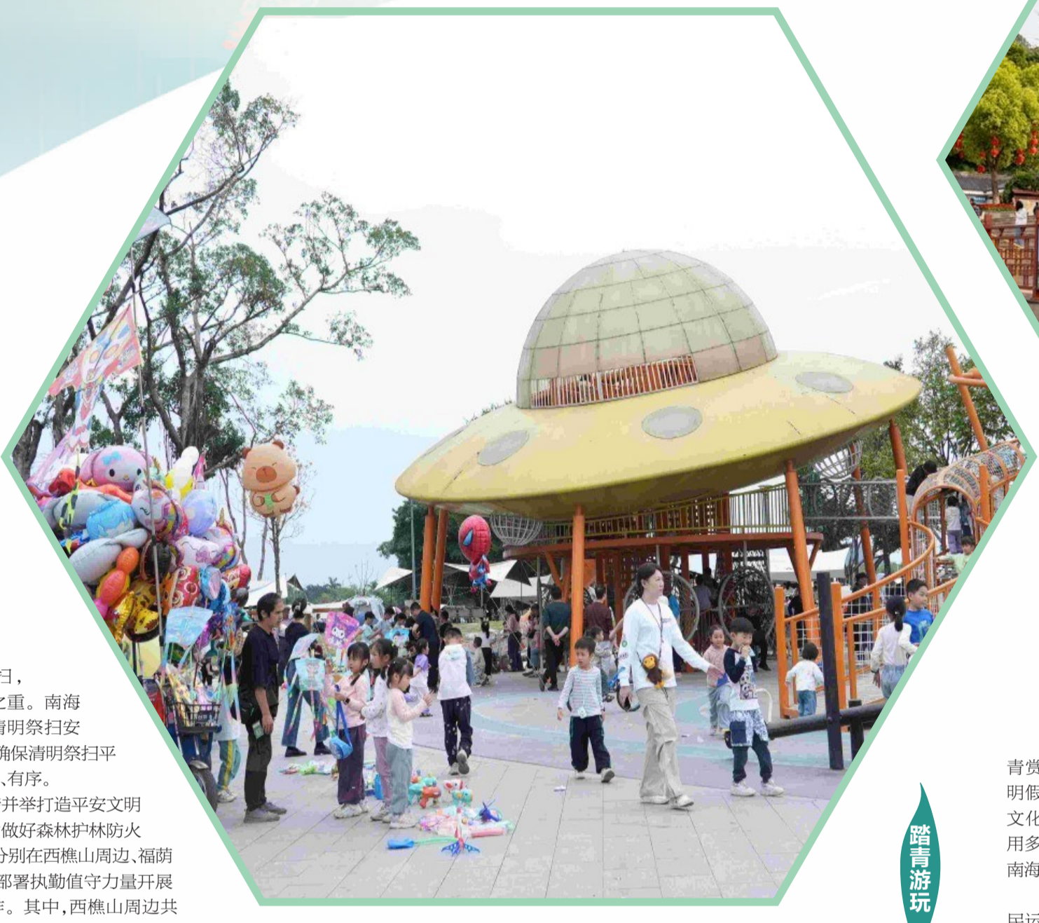
■市民在桂城半月岛生态公园游玩。

时值一年春草绿，又是一年清明时。4月4日~6日是清明假期，南海市民或前往各墓园祭拜先人，或到各大公园、景区踏青赏景，或到各大商圈游玩消费，度过了一段充实的时光。 其中，4月4日是“正清”，南海迎来第一波祭扫高峰，截至当天下午2时，全区“正清”祭扫人数近50万人。 清明祭扫高峰具有“短时间、小空间、高密度”的特点，结合往年情况，预计今年4月12日、13日仍有一波祭扫小高峰，无需预约，照常开放。南海民政部门提醒，请市民尽量搭乘公共交通前往，并积极配合有关部门的现场管理和安全检查。为避免不必要的麻烦和损失，请市民不要携带烟花爆竹、元宝蜡烛等易燃易爆品出行。