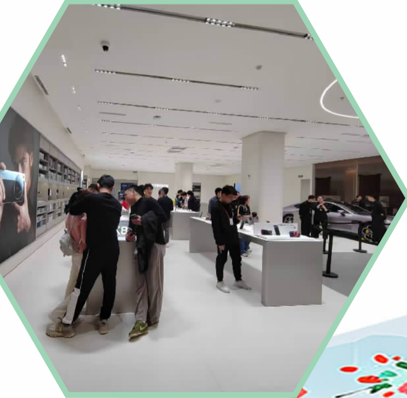
■在佛山金铂中心小米品牌店内，前来选购电子产品和汽车的市民络绎不绝。

在演艺广场，游园集市热闹非凡。木射乾坤、盲击夺金锣、竹影套玉环等传统游戏吸引大量游客参与体验。现场还有角色扮演NPC高燃亮相，与游客沉浸式互动，随机触发的隐藏福利更是为游玩增添了不少惊喜。而小朋友们尤其喜爱风筝义卖专场，他们发挥天马行空的创意，在风筝上绘出五彩斑斓的图案，玩得不亦乐乎。