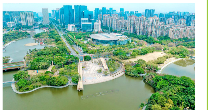
■千灯湖活水公园。(资料图)

千灯湖活水公园 推荐理由:SWA设计的非对称水系园林,白天感受岭南水乡,夜晚灯光倒映湖面如流动油画,出片率满分。 桂城滨江公园 推荐理由:全景玻璃书屋临水而建,捧书眺望江景;