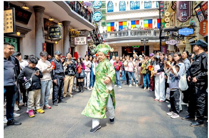
■著名演员黄一山空降广东千古情景区。

每个转身都是新剧本,人人皆是时空变量。在《我回1990》街头剧场,穿喇叭裤的演员突然将观众拉进剧情——戴蛤蟆镜的“大佬”递来大哥大:“靓女,有急call!”梳爆炸头的