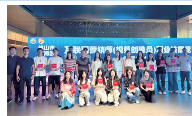
■互联网营销师(视频创推员)职业技能竞赛颁奖仪式。

竞赛包括理论知识和操作技能两部分,全面考核互联网营销师从业人员的职业素养。经过角逐,4位互联网营销师被授予“南海区技术能手”称号。