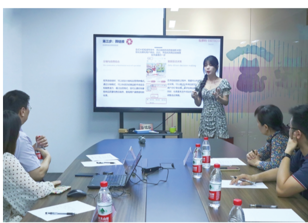
■电商讲师智库人才选拔赛现场,参赛选手模拟授课。

赛前,大赛组委会精心设置培训和辅导环节,为参赛选手指点迷津,提升关键技能,以选拔更多优质电商“授渔”者,为南海的电商发展及电商人才培养挖掘培养骨干和先锋力量。