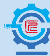
数字南海 工匠摇篮