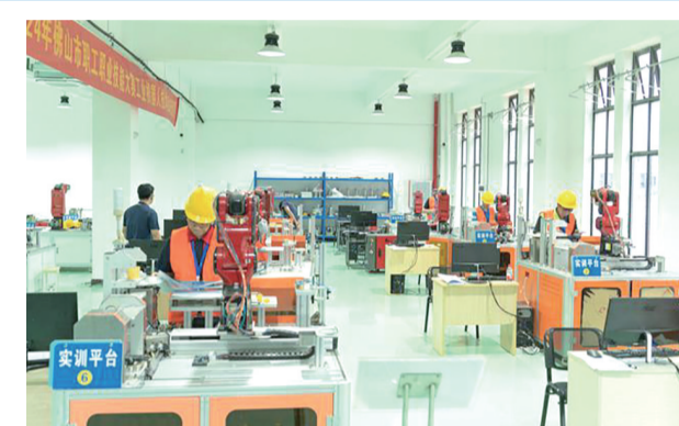
■在工业机器人技术应用项目技能竞赛决赛中,选手们同台竞技。

竞赛旨在引导广大工业机器人从业人员钻研业务、爱岗敬业,提高技能水平,加快培养工业机器人技能人才。