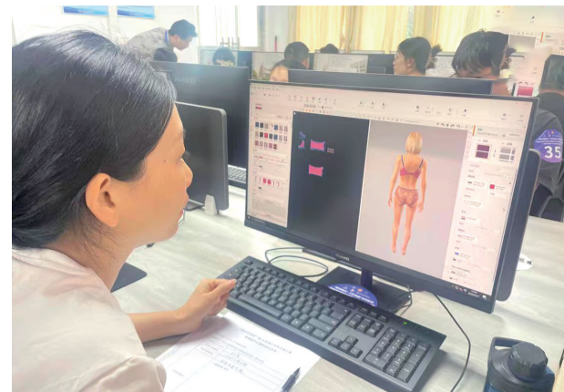
■3D内衣设计比赛中,选手认真设计内衣样式。

在实操竞赛中,参赛选手要在3.5小时内,运用3D设计软件,巧妙构思并设计出一件件惊艳眼球的内衣。