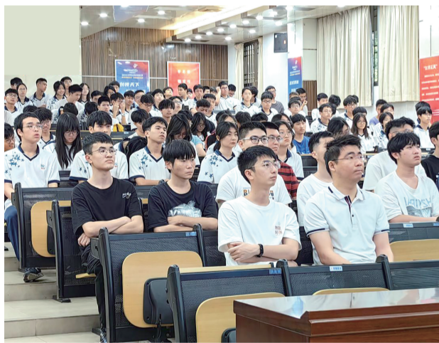
■赛前培训中,选手们认真听讲。

比赛启动后,吸引近百名职业院校师生及企业职工参与。赛事分学生组和职工组两个类别,学生组参赛者提交作品后由专家裁判集中评审,职工组选出前25名进入决赛,进行作品展示、阐述及答辩。