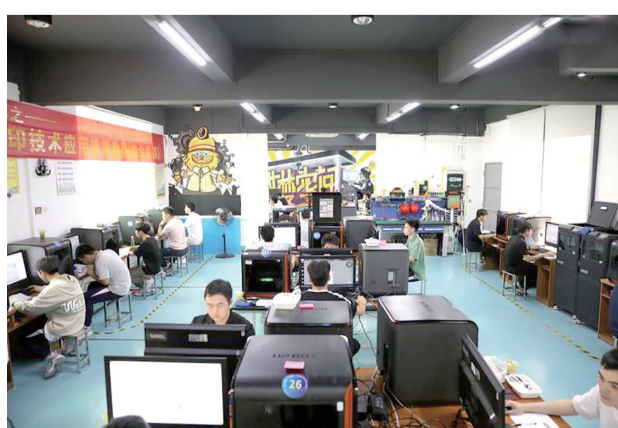
■南海区职业学校3D打印技术应用技能竞赛(校企)联赛现场。

本次比赛吸引了80名学生、教师、企业员工参加。在实操竞赛环节,选手们要在规定时间内,为一个不规则形状的翻页笔笔芯设计并制作外壳。