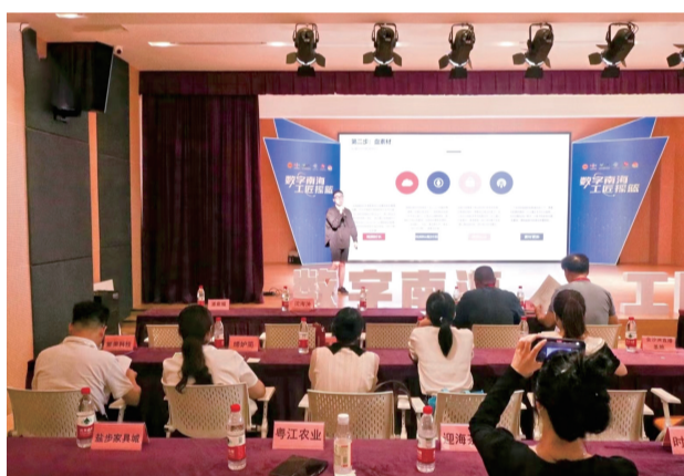
■数字经济“三创”挑战赛决赛现场,选手进行项目路演。