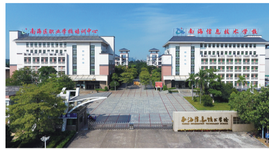
■南海区信息技术学校环境优美。