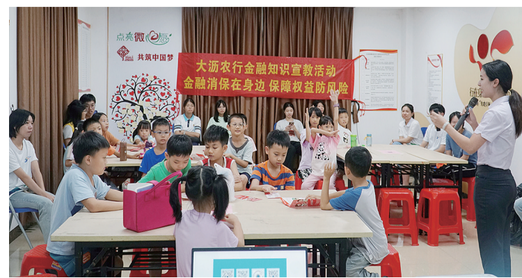
农行南海大沥支行党团志愿服务队走进社区开展儿童财商活动。