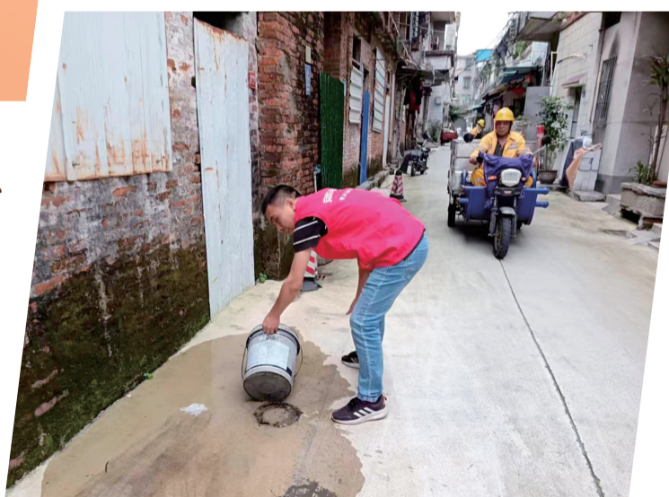
党员志愿者巡巷排查,及时清理久置的积水。