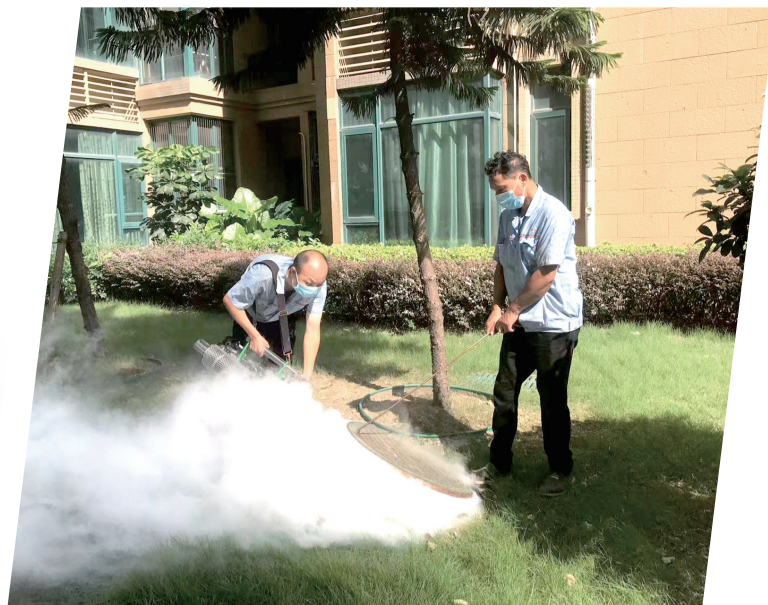
小区物业对公共区域进行灭蚊消杀。