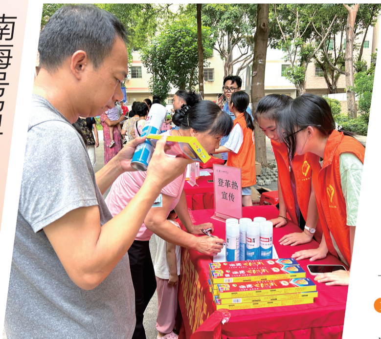
志愿者普及登革热预防知识,派发防蚊灭蚊用品。