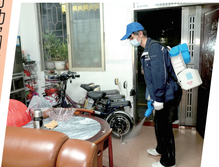
消杀队队员到居民家里开展防蚊消杀。