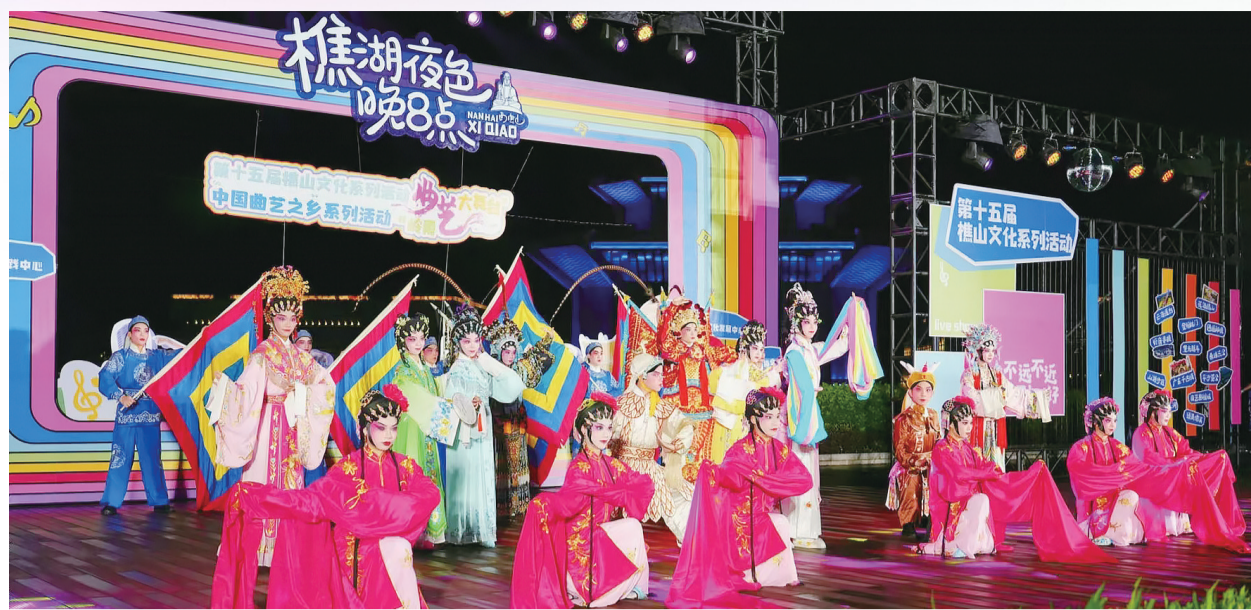
2024“樵湖夜色晚8点”听音湖周末文艺汇演启动。

珠江时报讯 记者陈肖玲 通讯员李婉心 李均良摄影报道 水袖飘飘,戏腔悠扬。5月26日晚8点,第十五届樵山文化系列活动——2024“樵湖夜色晚8点”听音湖周末文艺汇演拉开帷幕。首场以粤剧粤曲为主题的演出在听音湖畔舞台举行,吸引了过千名观众前来捧场。