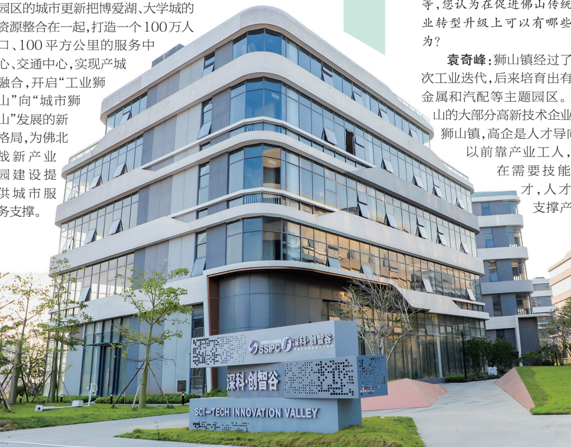
■深圳科技园佛山科创园位于佛山西站枢纽新城。