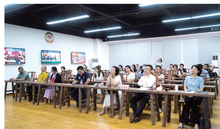
■政协委员们参加履职培训。