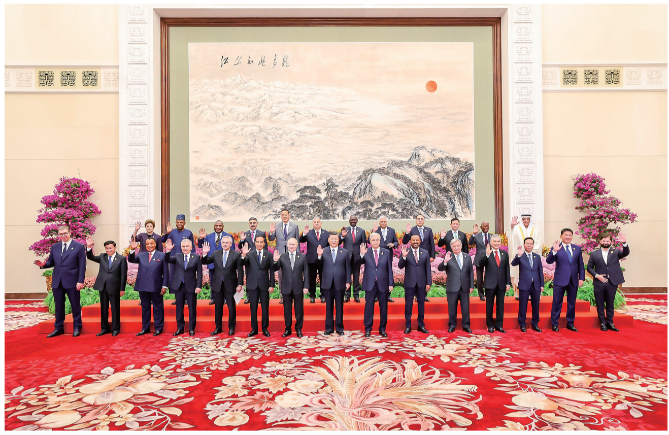
■10月18日上午，国家主席习近平在北京人民大会堂出席第三届“一带一路”国际合作高峰论坛开幕式并发表题为《建设开放包容、互联互通、共同发展的世界》的主旨演讲。