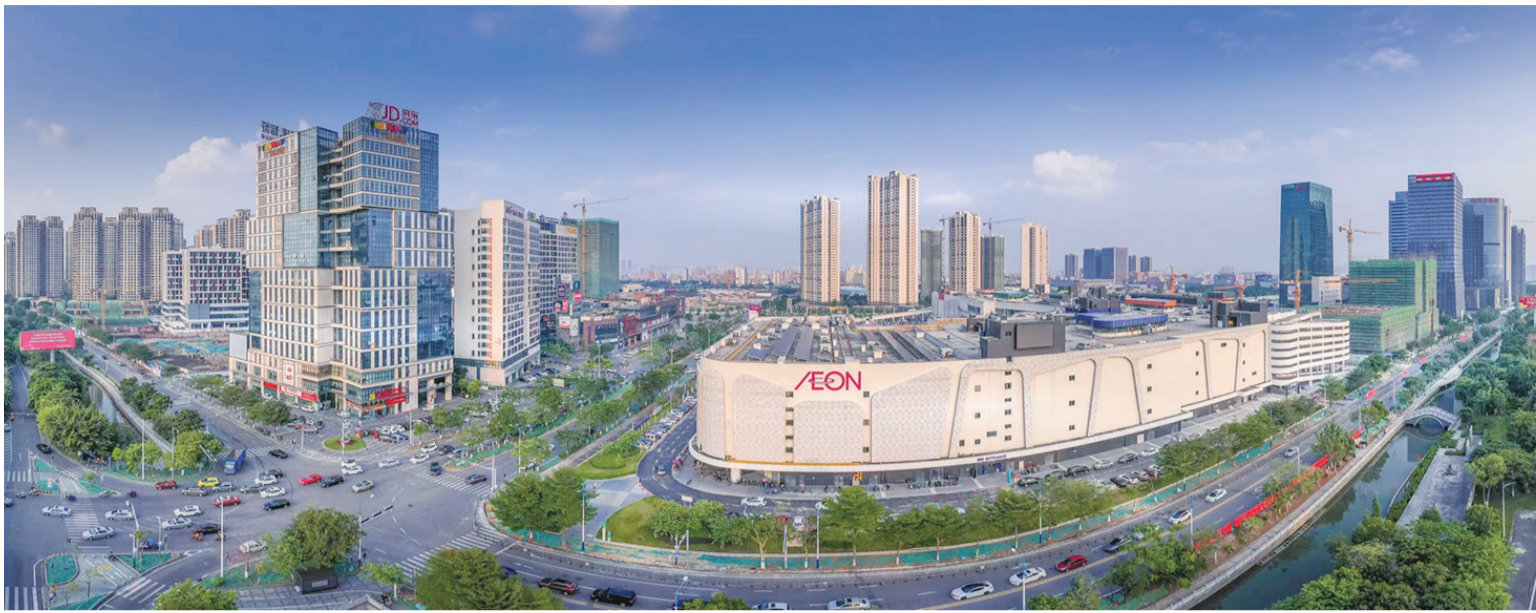
大沥广佛国际商贸城中心区。(资料图片)

“我在大沥土生土长,对这里的发展十分熟悉,也很有信心。”9月20日,坐落于广佛核心金沙洲片区的裕田未来科技城启动,看着这片蓄势待发的土