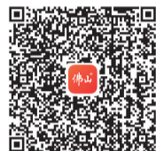
南企上榜名单 扫码看

该负责人表示,下一步,南海区市场监管局将继续强化区域品牌和企业品牌建设,以质量提升推动产业优化升级,打造更多“南海制造”优质品牌,提升南海品牌的影响力,助力南海区经济社会高质量发展。