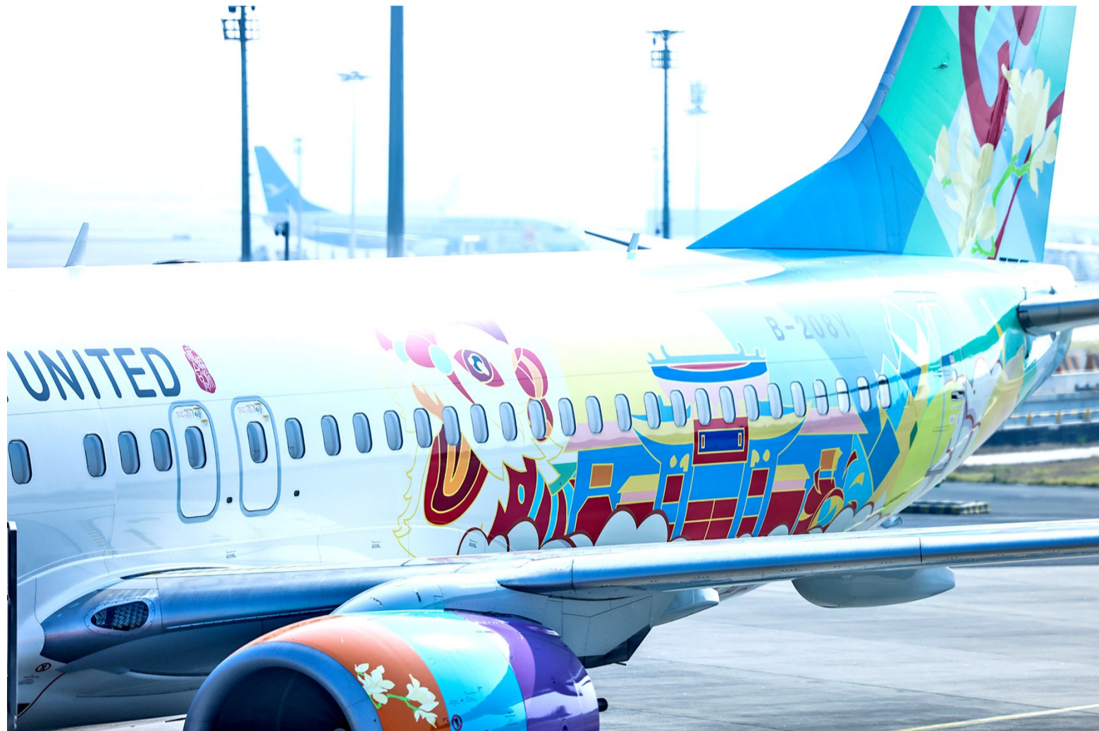
“佛山号”机身上,国家非物质文化遗产“醒狮”昂首长啸、栩栩如生。

作为中国联合航空第11架城市主题彩绘飞机,“佛山号”打造了一张靓丽的空中名片,以创新形式充分展示了佛山传古融今、包容开放的城市形象。