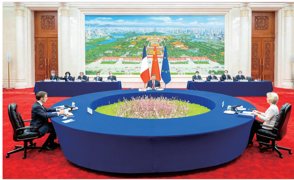
■4月6日下午，国家主席习近平在北京人民大会堂同法国总统马克龙、欧盟委员会主席冯德莱恩举行中法欧三方会晤。

据新华社电 4月6日下午，国家主席习近平在人民大会堂同法国总统马克龙、欧盟委员会主席冯德莱恩举行中法欧三方会晤。