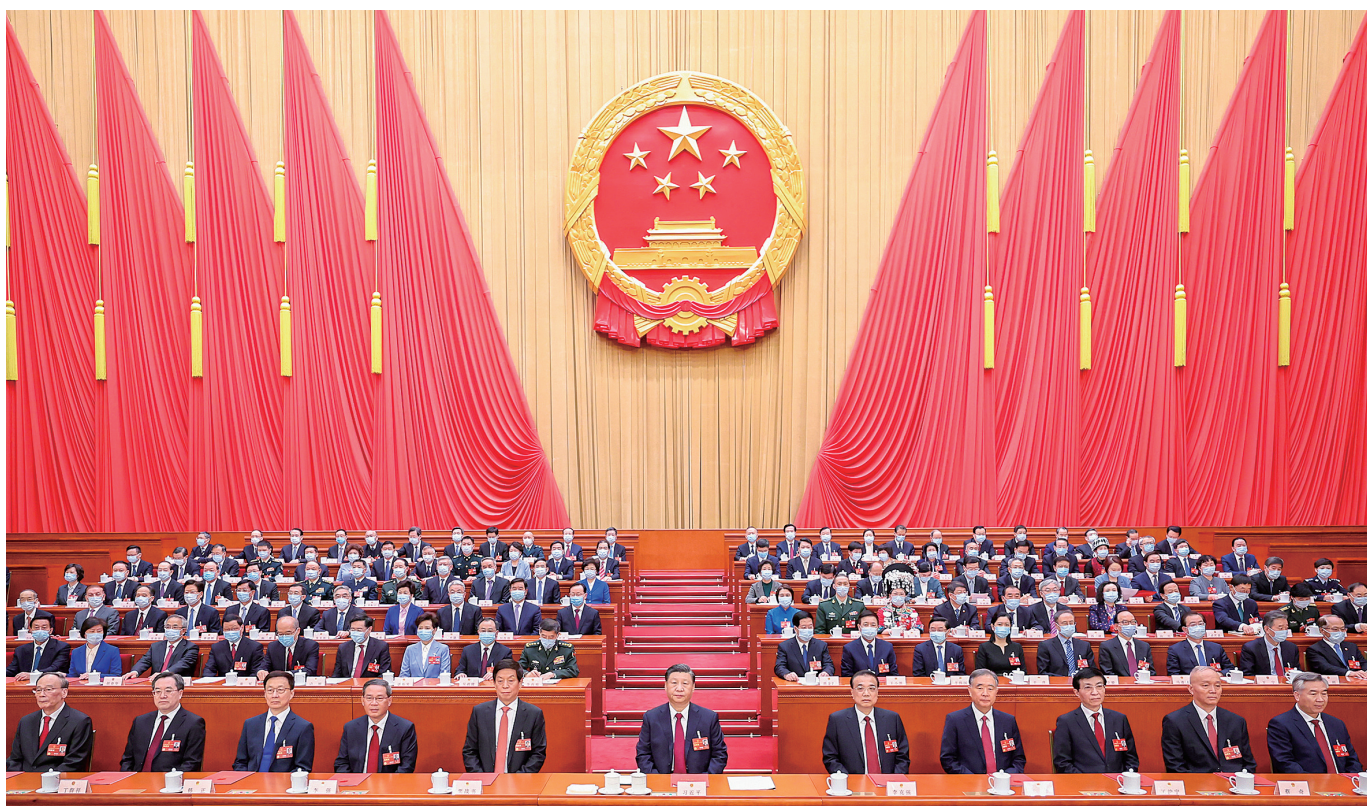
3月13日,第十四届全国人民代表大会第一次会议在北京人民大会堂闭幕。中共中央总书记、国家主席、中央军委主席习近平发表重要讲话。