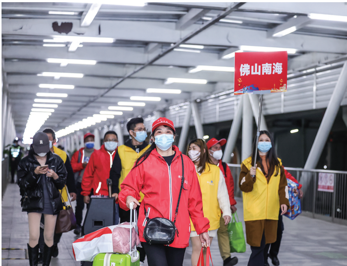
下了专列后，黔东南务工人员跟着南海的向导乘专车返回打工的企业。

随着春节假期的结束，返乡游子带着家人的祝福，揣着奋斗的梦想，再次背上行囊，踏上了返岗复工的专车、专列。