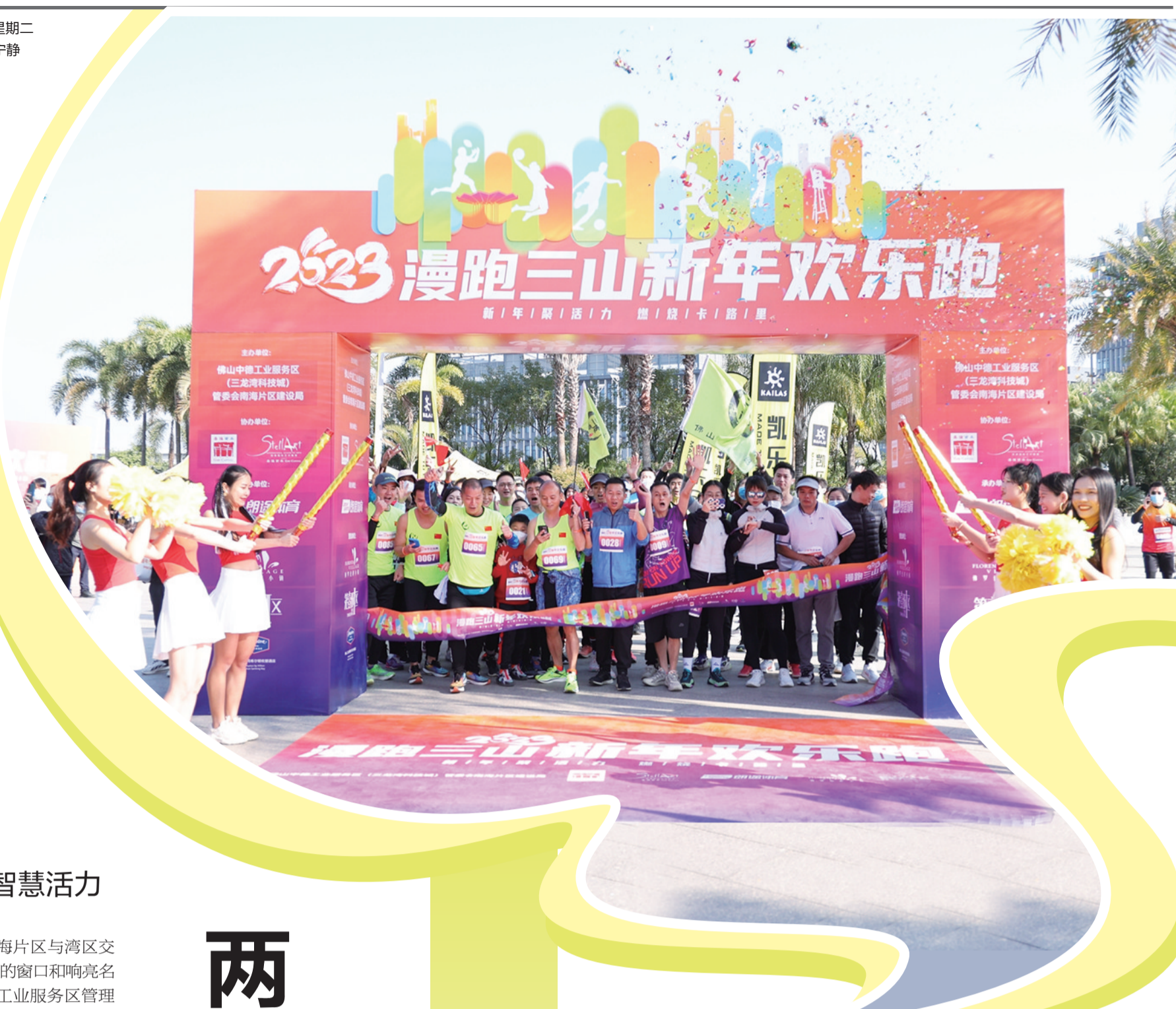
■“慢跑三山 新年欢乐跑”活动现场。

功举办，为三龙湾南海片区发展注入新活力 第一届『三山论坛』暨三龙湾科技城活力周成