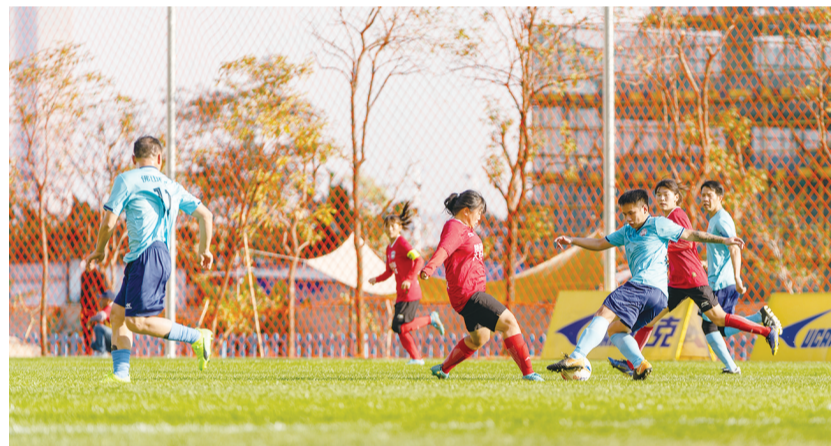
■球员们在文盈体育公园内的新足球场上挥洒汗水。