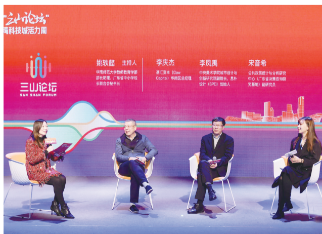
■第一届“三山论坛”上，大咖们进行热烈讨论。

三龙湾科技城活力周的成功举办，为三龙湾南海片区的经济和文旅体发展注入了新活力。而活力周的闭幕，是三龙湾南海片区不断焕发产业活力、城市活力、经济活力、艺术活力、文化活力的新开始。接下来，三龙湾南海片区将把活力周激发出的宝贵精神注入现代化建设的征程，把健康运动焕发出的火热激情投入高质量发展的实践，跑好发展“接力赛”，赛出发展“加速度”，为建设现代化活力新南海注入源源不断的活力。