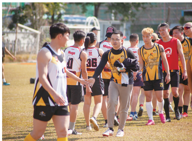
■众多橄榄球爱好者齐聚三山参与比赛。