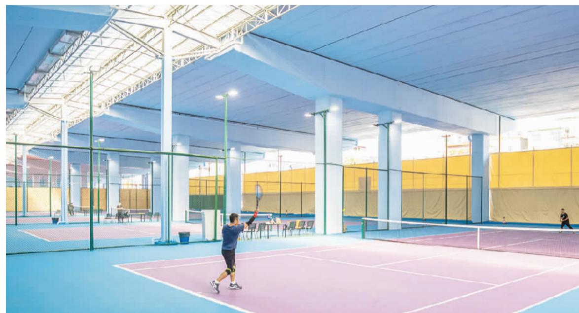
■大沥镇将广佛江珠高速大沥段广佛路至新干线路段桥下闲置空间改造成网球主题公园。

此外,南海进一步优化城市绿色空间布局,推进市政公园、社区(体育)公园、口袋公园等建设。2022年全区共启动大中小型城市公园绿地建设12项,改造新增绿地面积约86.93万平方米。同时,南海区大力发展儿童友好城市建设,一批设有儿童设施的公园建设项目正在稳步推进。