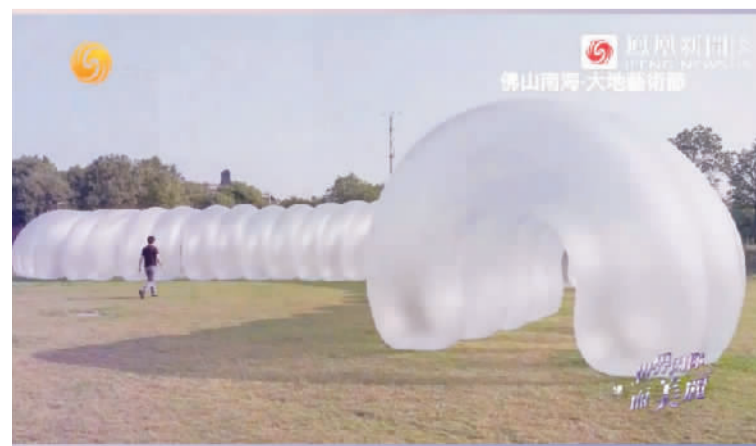
■凤凰卫视中文台《世界因你而美丽》栏目介绍南海大地艺术节盛况。