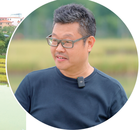
■艺术家、中国美术学院雕塑与公共艺术学院教授沈烈毅。