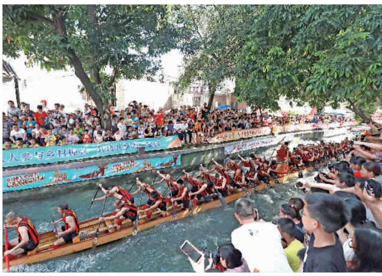
■龙舟已成为南海重要的岭南文化IP，每届叠滘龙舟漂移大赛都吸引来众多市民游客。