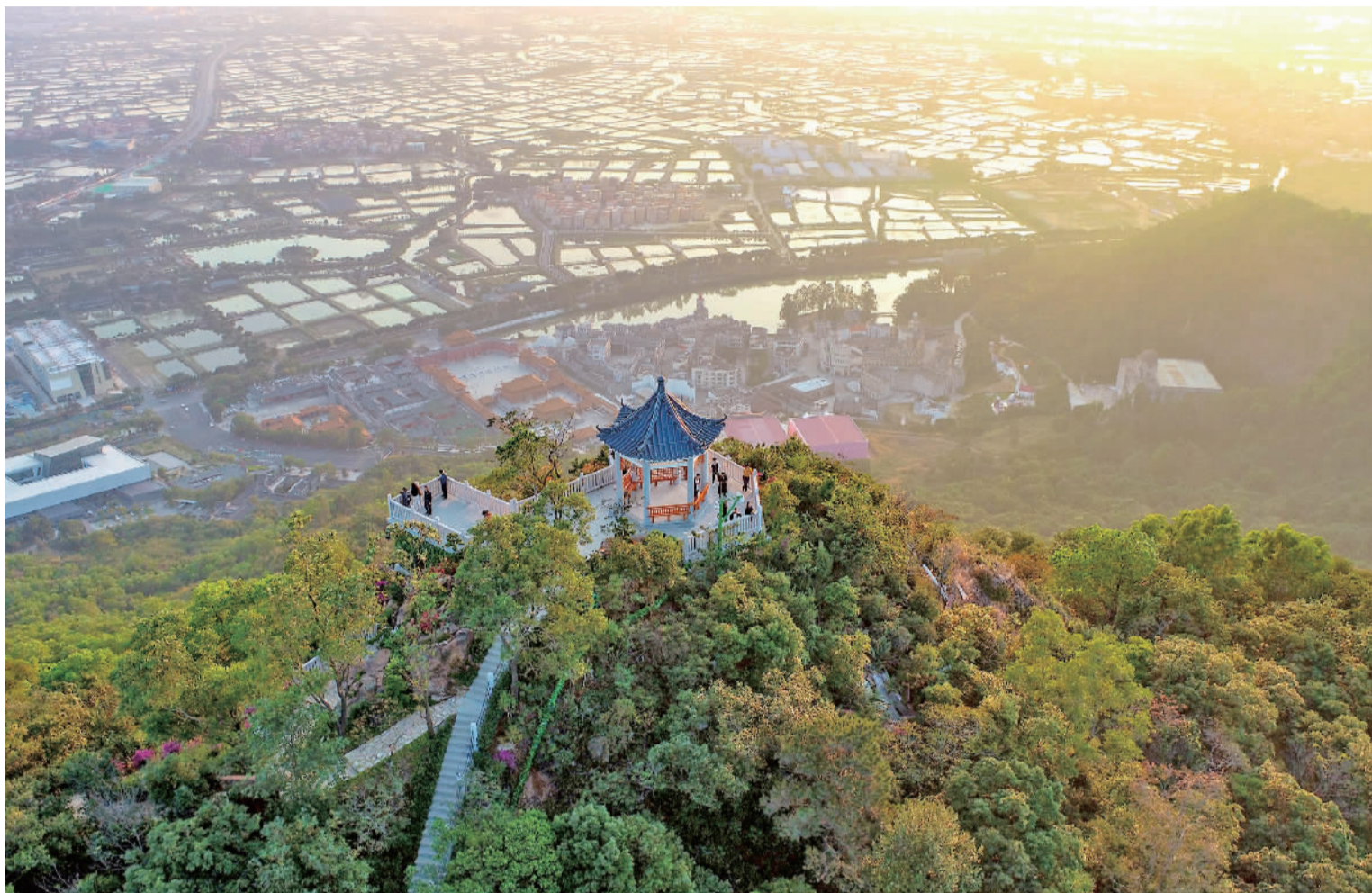
■被誉为“珠江文明的灯塔”的西樵山，山下万亩桑基鱼塘环绕。

文脉是城市诞生与演进过程中形成的历史印记，折射着一方水土的精神与气质。梳理南海文脉，可以深切地感受到，深厚的文化底蕴、深沉的文化自信，赋予了南海人海纳百川的襟怀、随形赋势的智慧、万折必东的意志，塑造了今天南海充满活力范、敬畏感、烟火气、人情味的城市气质。