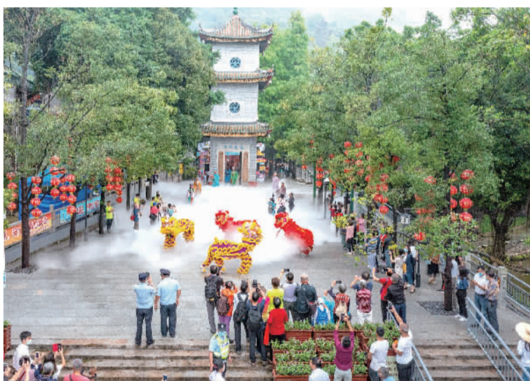
■“新西樵·最岭南”2022西樵“大仙诞”非遗民俗文化活动上演。