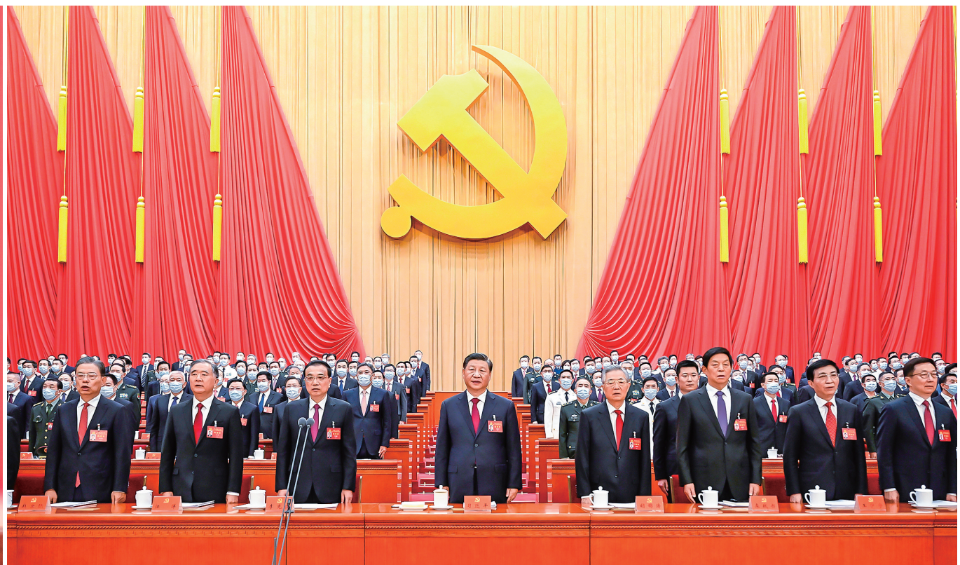
10月16日，中国共产党第二十次全国代表大会在北京人民大会堂开幕。习近平代表第十九届中央委员会向大会作报告。