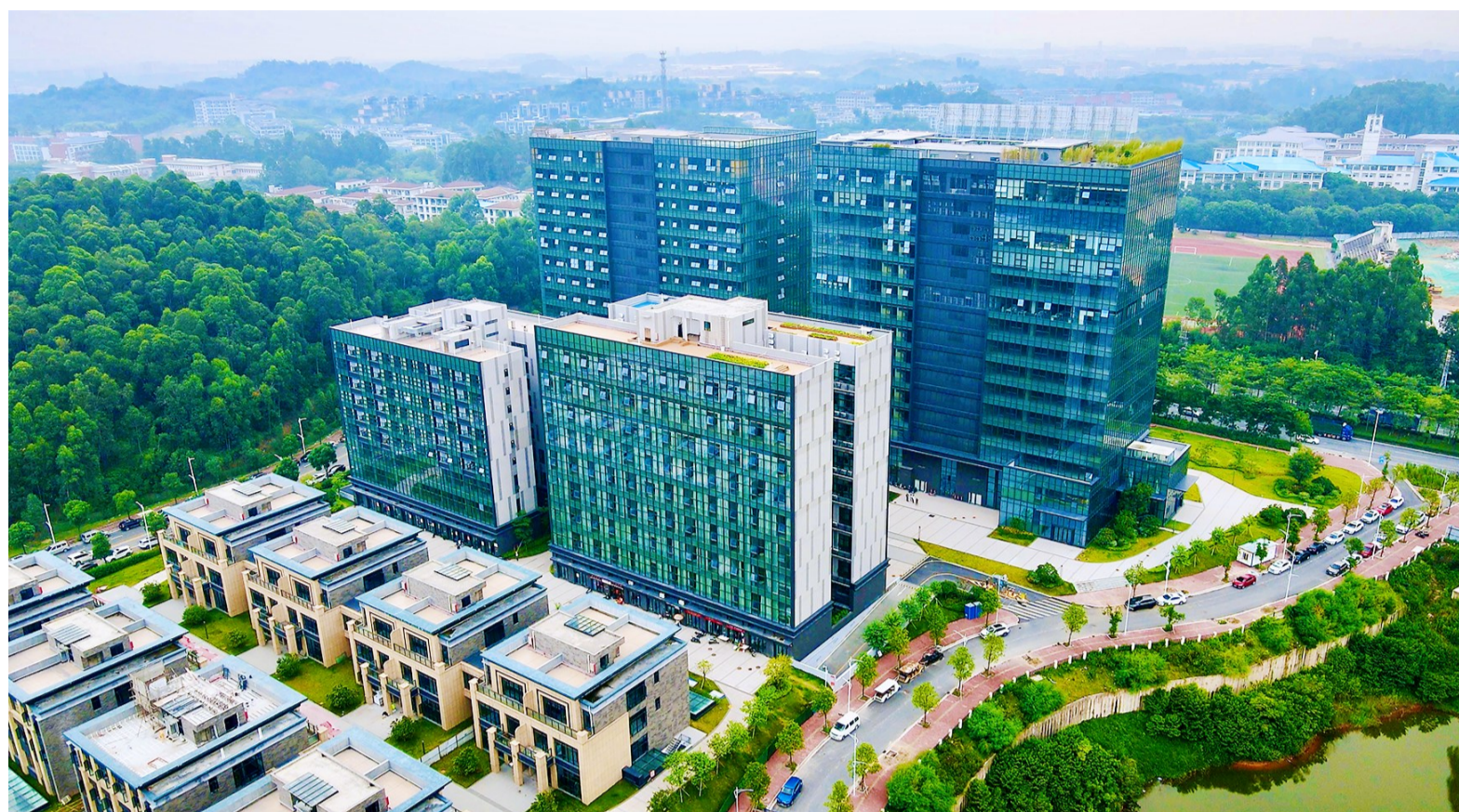
佛山·创新灯塔人才公寓——博士楼。

人才是第一资源,是引领高质量发展的强大引擎。纵观狮山发展历程,始终如一尊企重企,尊才惜才。如2022年,在全市镇街中首设“企业服务日”,出台营商环境十条,用一流营商环境润泽一流创业沃土,用最贴心的服务换来企业最顺心的发展,让每一位企业家都能在狮山安心创大业、放心做生意。