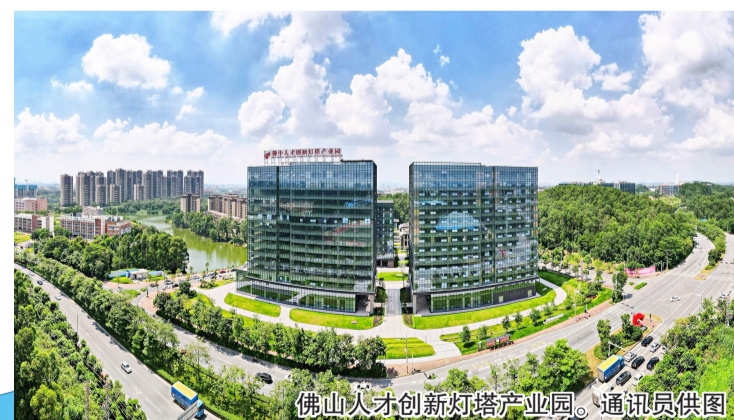
佛山人才创新灯塔产业园。