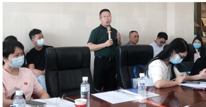
每月企业服务日,狮山相关部门走进企业收集发展遇到的问题。

创新之道,唯在得人。得人之要,必广其途以储之。上述种种,皆是狮山对引才、用才、育才、留才的态度——坚持党管人才,形成“人人抓人才工作,处处提升人才生态”的主动格局。