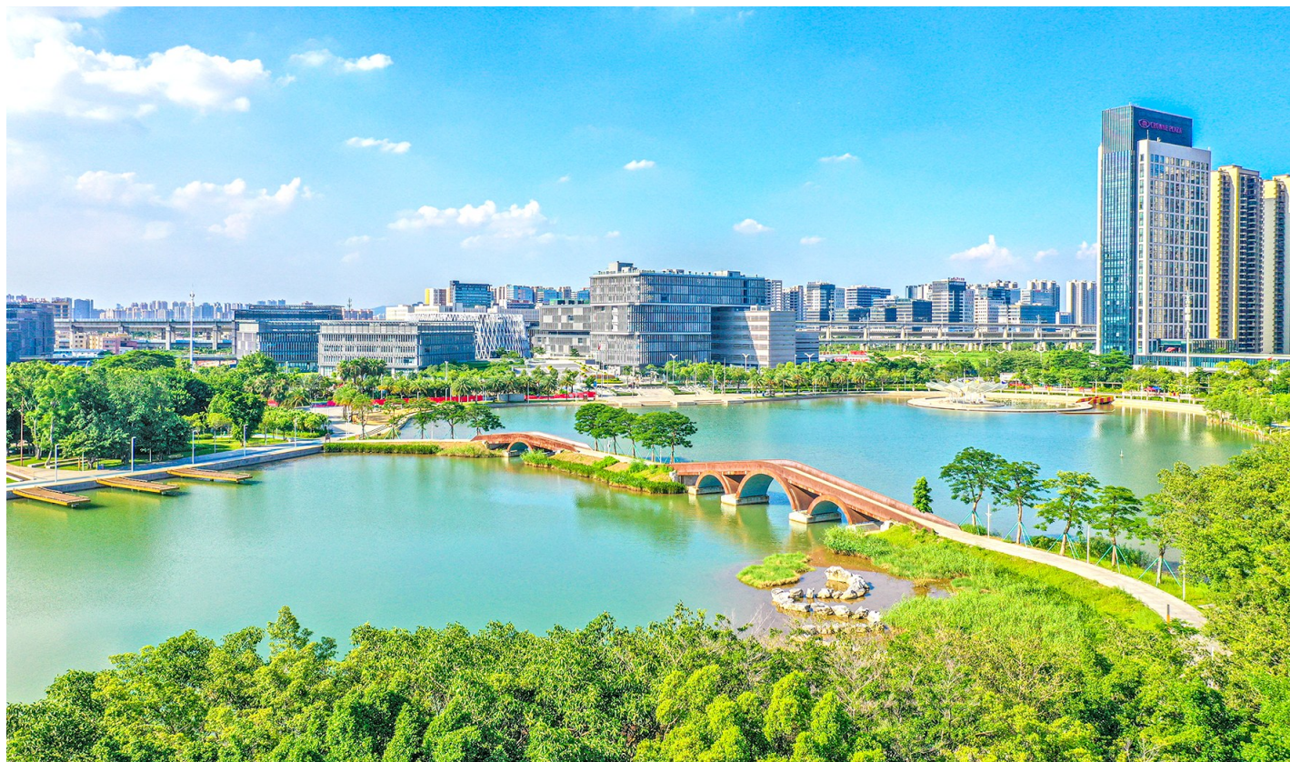
■南海宜居宜业宜创新氛围,吸引各类人才纷至沓来。图为文翰湖旁的季华实验室。

人才是创新发展的第一资源。近年来,南海始终把发展人才事业作为立区之本、竞争之基、转型之要,厚植人才成长沃土,以最大诚意、最好资源、最优服务礼遇人才,让各类人才在南海创业有机会、干事有舞台、发展有空间。