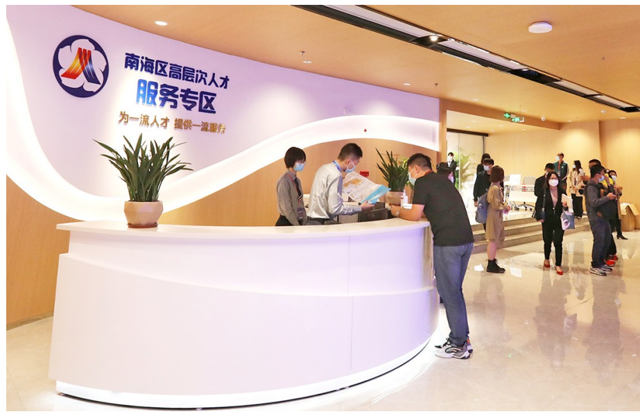
■南海为高层次人才设立服务专区。

截至9月,南海荟聚超58万名英才、87名国家高层次人才,建成28万人规模的技能人才队伍,多项指标位居省内同级地区前列。