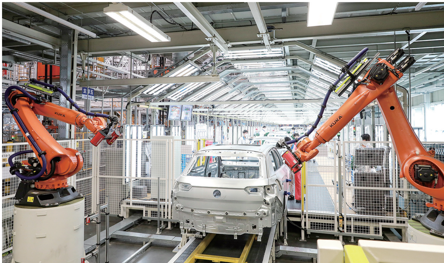
■在一汽-大众汽车有限公司佛山分公司，机器人正在生产汽车。