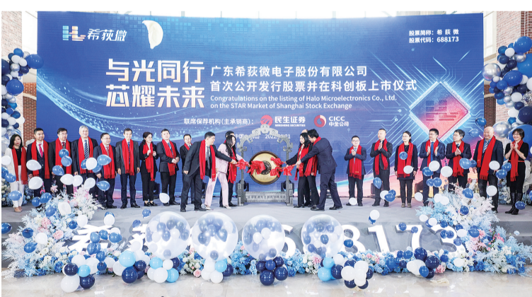
■2022年1月21日，希荻微在上海证券交易所科创板正式上市。

十载砥砺前行，十载春华秋实。随着城市品质的不断提升，“两高四新”产业逐渐成为经济发展主动力，人的活力不断释放，现代化活力新南海的梦想将加快走进现实。