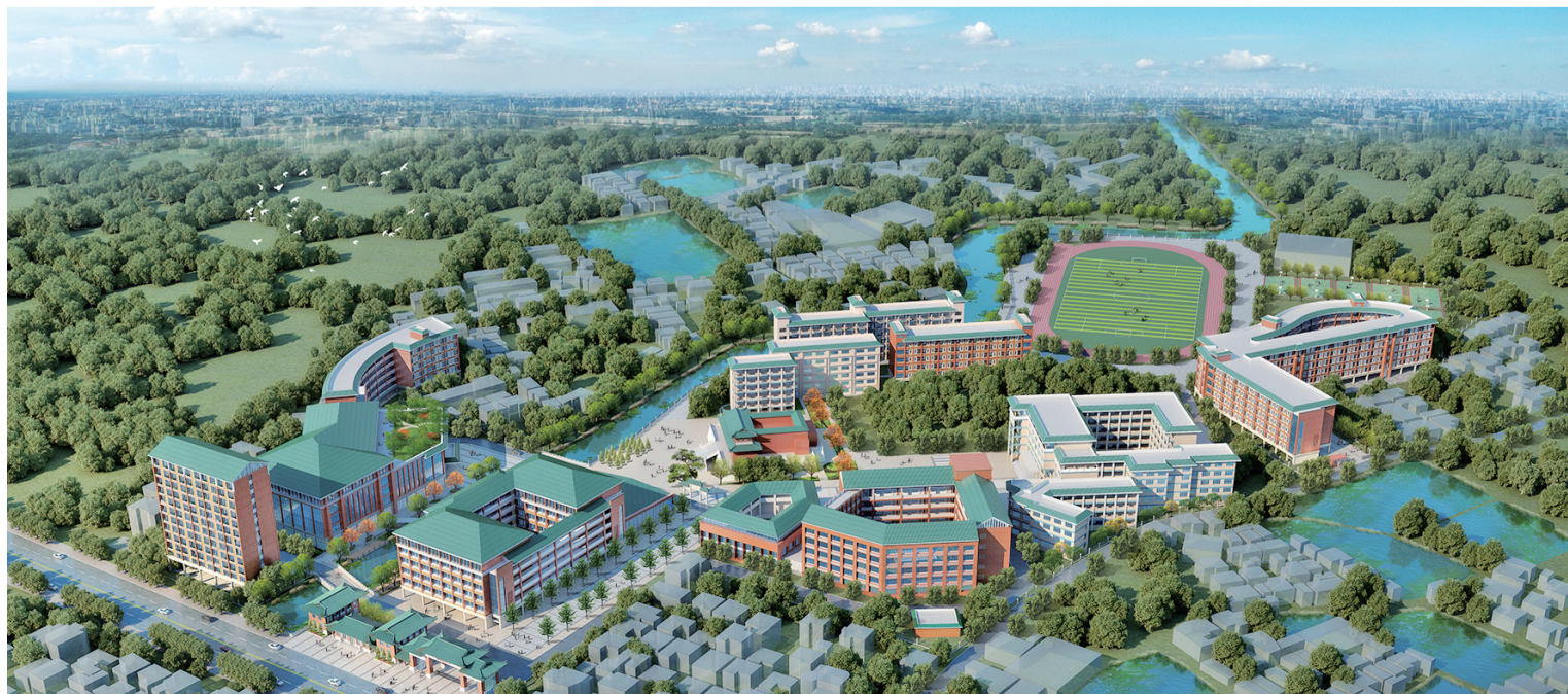
九江中学整体鸟瞰图。

据九江中学相关负责人介绍，目前综合楼及图文中心项目已启动建设，按计划将在2023年投入使用。学生饭堂、宿舍楼、教学楼、报告厅等后续配套将逐步建成。九江中学将把握发展契机，进一步优化师生的工作、学习和生活环境，进一步提升教育教学质量，将学校建设成为一所拥有深厚文化底蕴、优美校园环境和优秀教育质量的现代岭南名校。