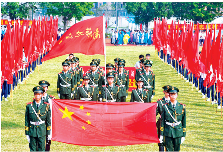
威武帅气的国旗班。