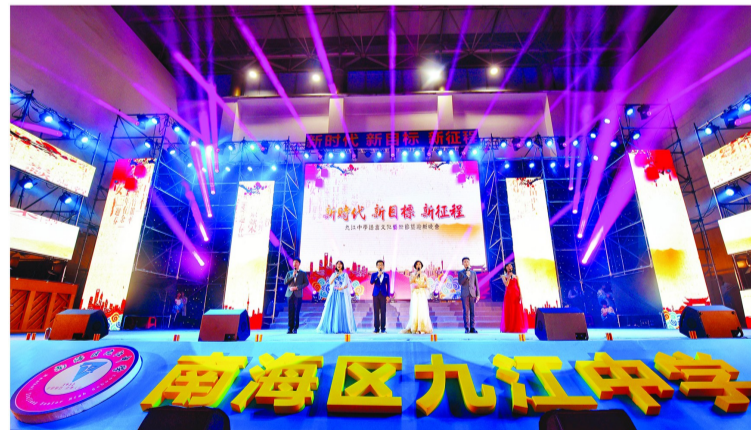
九江中学语言文化节暨迎新晚会。

多姿多彩的校园体艺活动，由学生全程参与活动策划、活动筹备和实施过程，既锻炼了组织者和参与者的组织协调能、人际交往能力、科技创新能力、语言表达能力等，又在活动中强化了学生的品德和价值观，培养全面发展的未来人才。