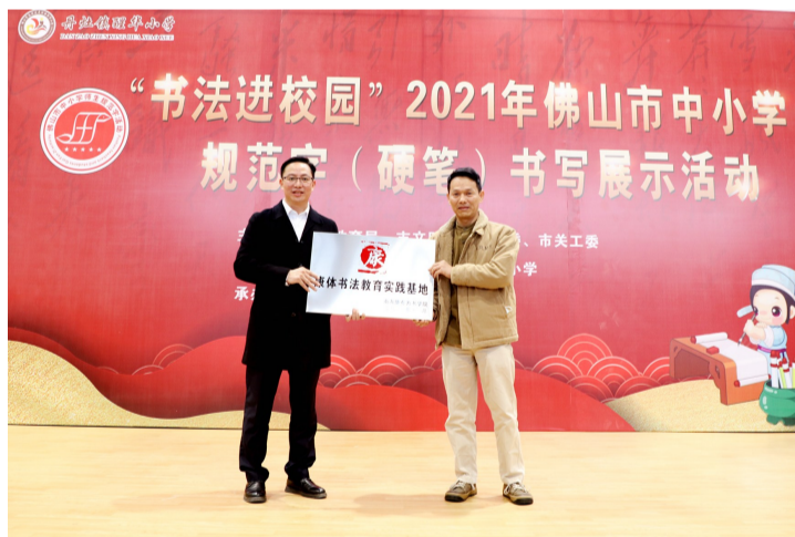
■为丹灶醒华小学康体书法教育实践基地授牌。