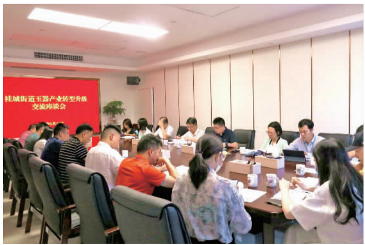
桂城街道玉器产业转型升级交流座谈会举行。

除此之外,平洲玉器珠宝小镇管委会着力探索产学研合作新路径,推动NGTC教育实训基地、珠宝首饰行业职业技能等级认定佛山南海考点项目相继落户小镇,同时推动《翡翠玉器销售服务规范》《翡翠饰品商业评价服务规范》两个佛山地方标准顺利立项申报,让“产、学、研”的力量在小镇上勃发生长;着力举办各项大赛,以赛聚才,建设人才集聚新高地等。截至2022年5月,桂城平洲获得各级称号、职称和认定的玉雕大师及人才达219人,其中五类以上玉器人才63人;市场主体总数达到约6000多个,其中珠宝类经营门店3000多家、玉器珠宝加工厂500多家。