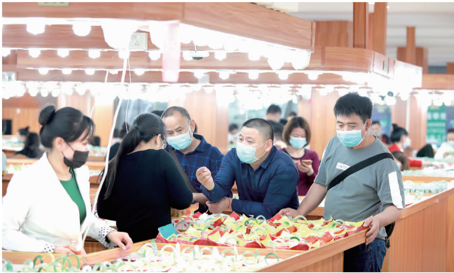
市民在平洲玉器街挑选玉器。