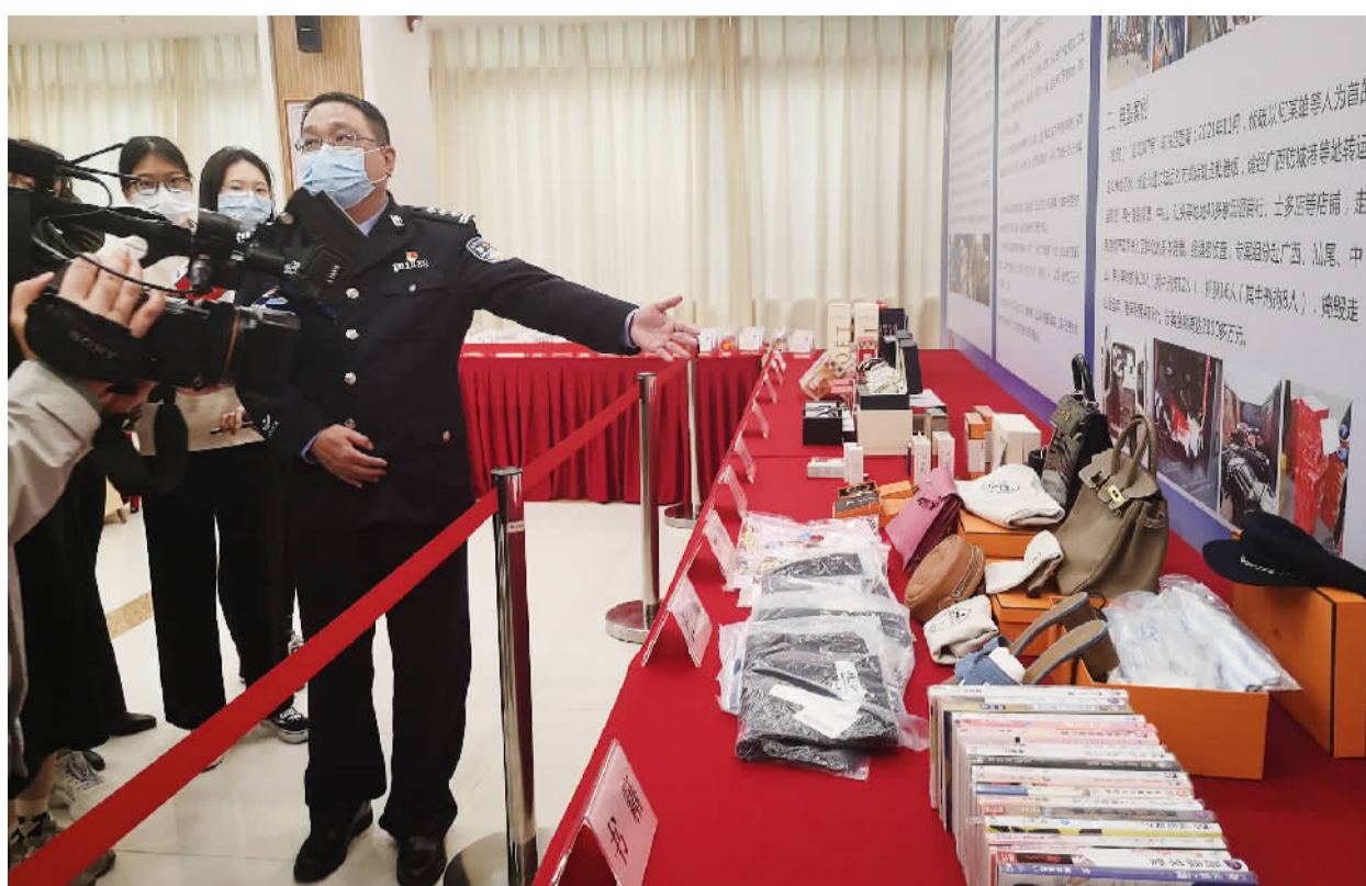
■民警介绍查获的涉案物品。

这是佛山警方雷霆打击走私犯罪的一个缩影。2021年以来,一些不法分子频频利用“大飞”、大型货船等运输工具,在佛山河网水道进行走私犯罪活动。对此,佛山市副市长、佛山市打私领导小组组长,佛山市公