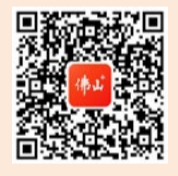
扫码看狮山高质量发展大讨论