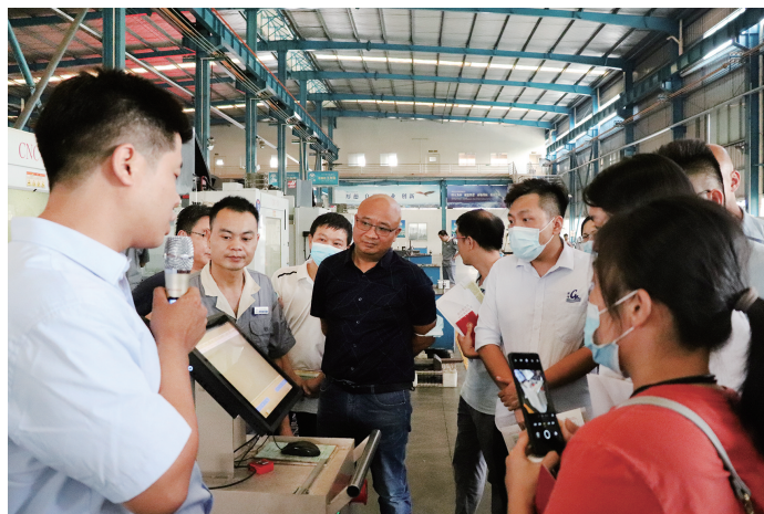
■广东腾一科技有限公司为制造企业设计数字化转型方案。