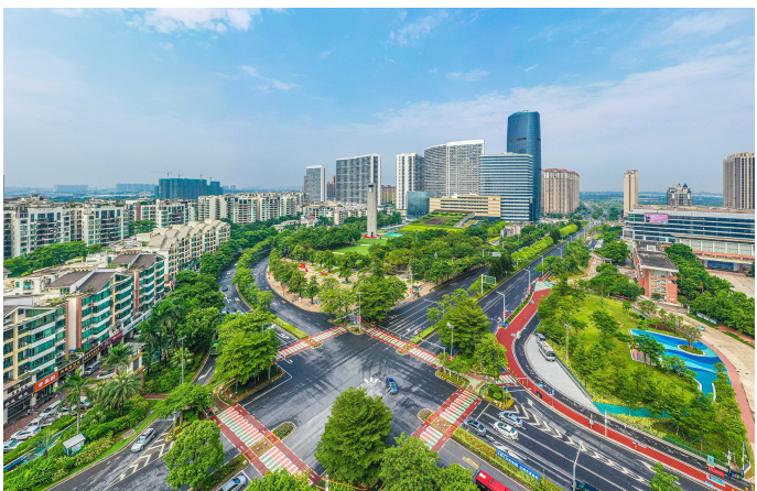
■狮山以佛山西站枢纽新城为先导区,以官窑国家物流枢纽为供应链型节点,以博爱新城为文产融合型节点,搭建“一区两节点”的两业融合载体。

“必须遇到困难解决困难,遇到问题解决问题。”正如盘石在调研时所言,狮山要直面问题不回避,解决问题不畏难,写好一份产业创新发展的“信心答卷”。