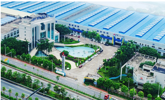
■位于佛山南海的中国(广东)机器人集成创新中心已集聚32家机器人企业。