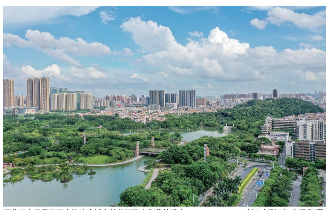
■蓝天白云见证了南海这座城市的美丽蝶变和蓬勃活力。

加坚定:惟有人民至上才能无往不胜,惟有坚守实业才能赢得未来,惟有干在实处才能走在前列,惟有改革创新才能开创新局。