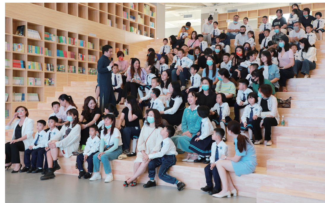
狮山实验学校一年级学生家长进课堂听课。

体会,她对精细化管理的认识是每一项工作、每一处细节、每一个流程都要提前规划,注重落实效果和反思改进,细致周到地进行班级和级部的管理。