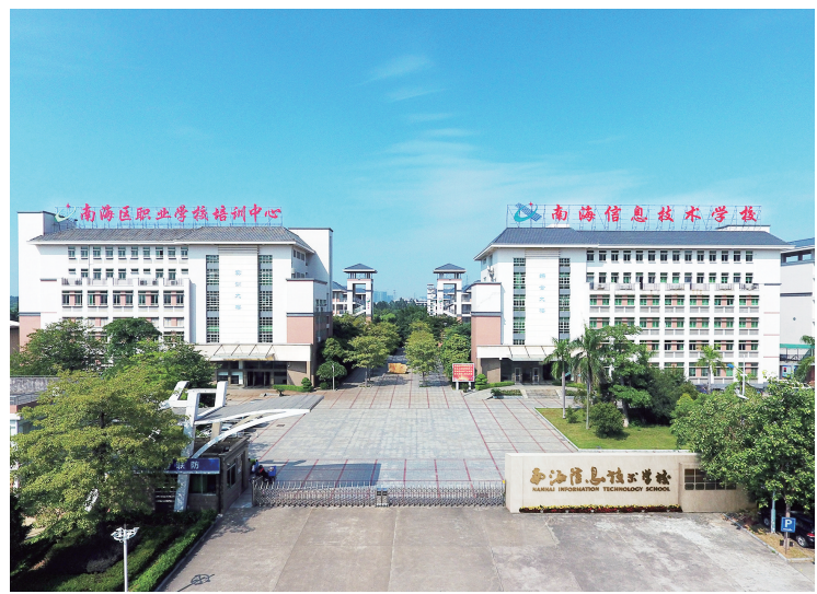
南海信息技术学校。(资料图片)