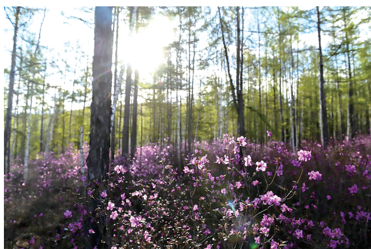
■图为内蒙古自治区额尔古纳市大兴安岭林区(资料图片)。