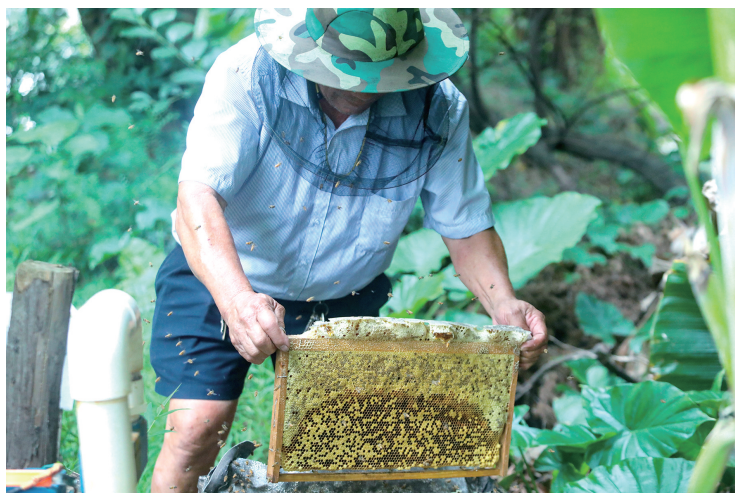
■检查蜂巢,蜜蜂在身边翩翩起舞。