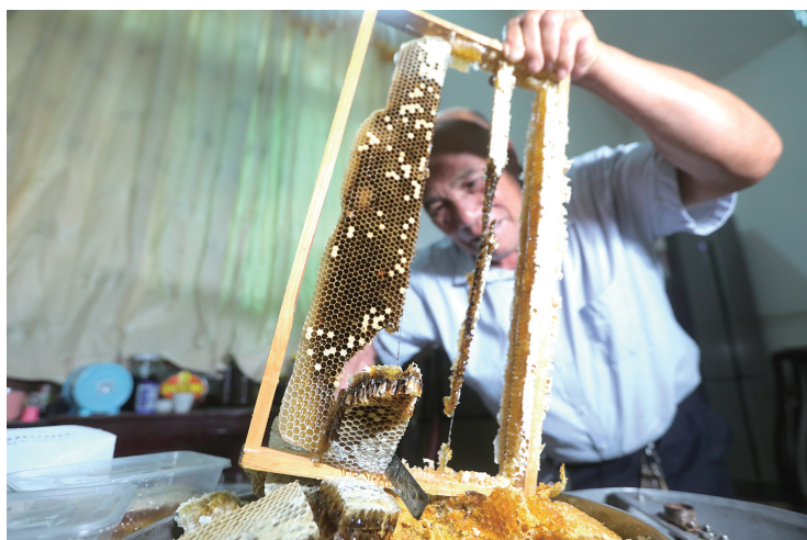
■从蜂巢上切下来的“蜂巢蜜”,散发着醉人的香味。