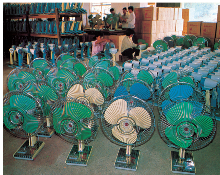
■上世纪80年代公社办企业生产的产品。

南海之所以能成为全国民营经济最活跃的地区之一，并不是偶然，而是几十年政企良性互动的结果。民营企业是南海的“本”。民营经济的活跃和强大，成就了南海经济的辉煌，书写了改革开放进程中最精彩的南海故事。