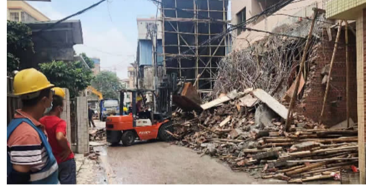
■工作人员拆除违建物。

6月11日,桂城街道查治办组织街道综治办、街道综合执法办、街道农业农村办、平洲派出所、林岳社区等部门,对林岳社区西三前岸坊26号东南侧新增违建开展拆除。据了解,该事主在未取得相关审批手续的情况下,擅自占用公共资源和集体用地,并抱着侥幸心理,于防疫期间顶风加建。目前该违建已建成2层,面积约50