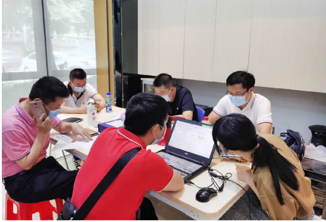
■南海区信访局工作专班设立服务热线,24小时接听群众来电。

转交给部门快办快结24小时内回复,困难问题及时上报区疫情防控指挥部协调解决,切实做到群众诉求件件有着落、事事有回音。