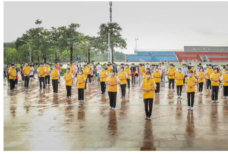
■广东东软学院学生列队组成心形向医护人员表示感谢。

珠江时报讯(记者/彭燕燕 通讯员/张亚川)“感谢医护人员,你们就是夜空中最亮的星!”6月9日下午6时30分,在广东东软学院收拾完新冠疫苗接种现场的南海公共卫生医院医护人员们正准备离去时,一阵歌声传到了他们的耳中。列队比心形、鞠躬话感恩、举着横幅夹道相送……闻声走出的医护人员被广东东软学院学子们自发组织的欢送仪式所感动,温馨的场景让人不禁泪目。