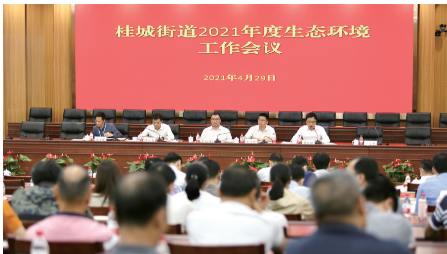
桂城街道召开生态环境、安全生产暨疫情防控工作会议。

珠江时报讯(记者/邹韵斯 通讯员/郭梓然)4月29日下午,桂城街道召开生态环境、安全生产暨疫情防控工作会议,深入打好污染防治攻坚战,做好第二轮中央环保督察迎检工作,推动街道生态环境质量持续改善,同时做好节前安全生产和疫情防控工作。