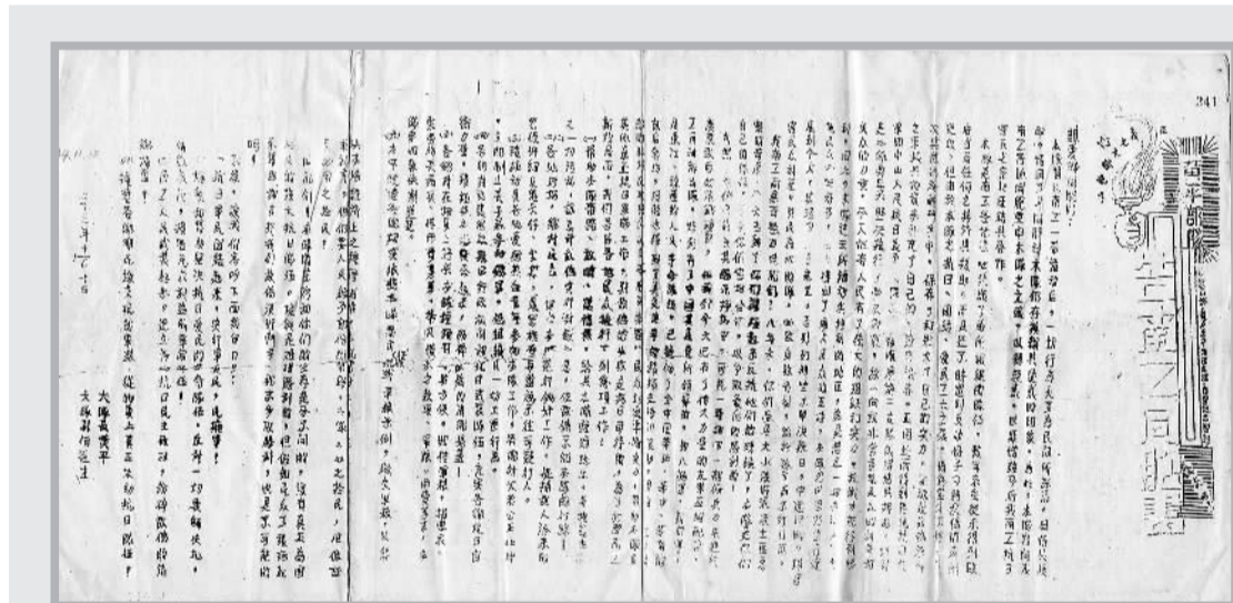
《黄平部队告南三同胞书》

在当地，南三大队公开发表《黄平部队告南三同胞书》，阐明部队“抗日、团结、爱民”的三大主张。同时采取军事行动，如开展锄奸活动，袭击三水南边圩的伪警备队，给敌人以迎头痛击，使民众的抗日情绪为之大振。一批具有抗日救国思想的青少年积极加入，部队迅速发展至200余人。