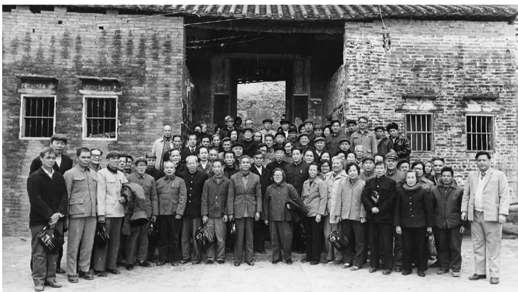
1985年1月15日，珠江纵队独立第三大队部分老战士在队部旧址(位于今狮山镇沙头社区)合影

在党的领导下，广游二支队一面整顿队伍，清除抗战不坚定分子；一面充实队伍，组建广游二支队独立第一中队。1941年7月，广游二支队整编为三个中队，由中共南(海)番(禺)中(山)顺(德)中心县委直接领导，形成珠江敌后抗战的核心力量，使珠江地区的抗战进入了新的阶段。