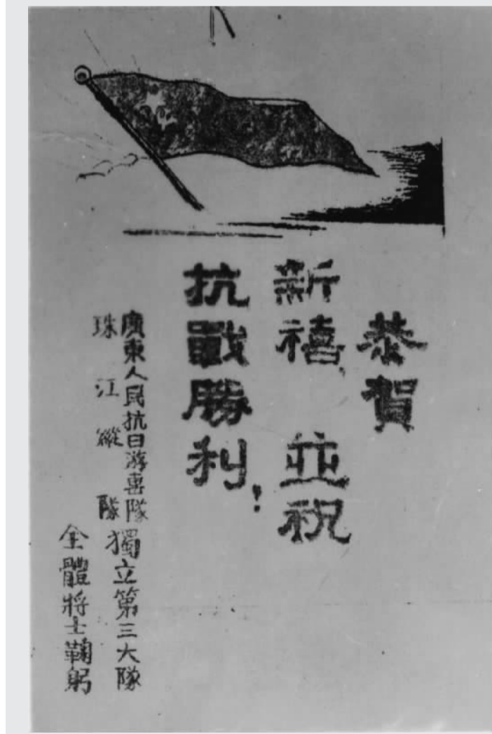
珠江纵队独立第三大队成立时印发“恭贺新禧，并祝抗战胜利”的贺年卡片