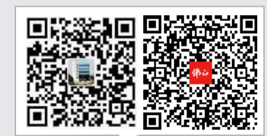
扫码一下，了解红色南海的百年故事