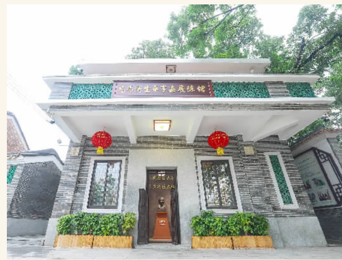
■区梦觉生平事迹展馆。