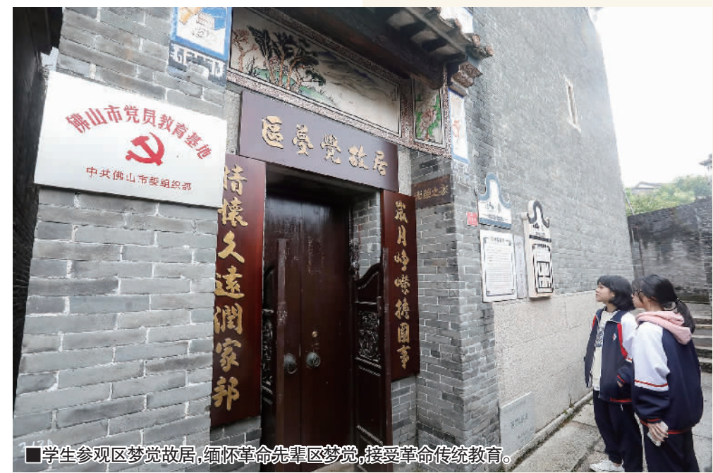
■学生参观区梦觉故居，缅怀革命先辈区梦觉，接受革命传统教育。

1948年，区梦觉出席在匈牙利召开的国际妇女代表大会；1949年4月，在第一次全国妇女代表大会上，区梦觉被选为第一届全国妇联常委兼秘书长。