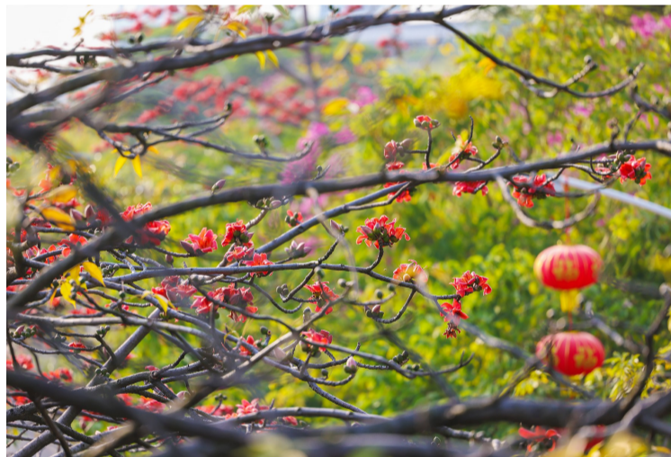
■海三路的木棉花红艳似火。