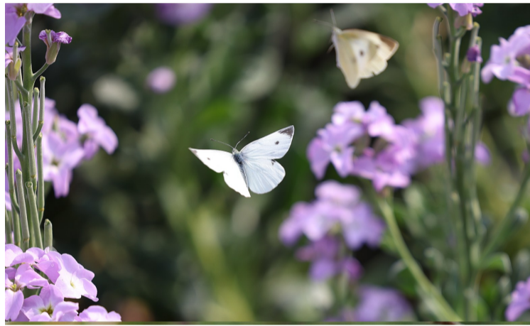
■蝴蝶围着桃花翩翩起舞。