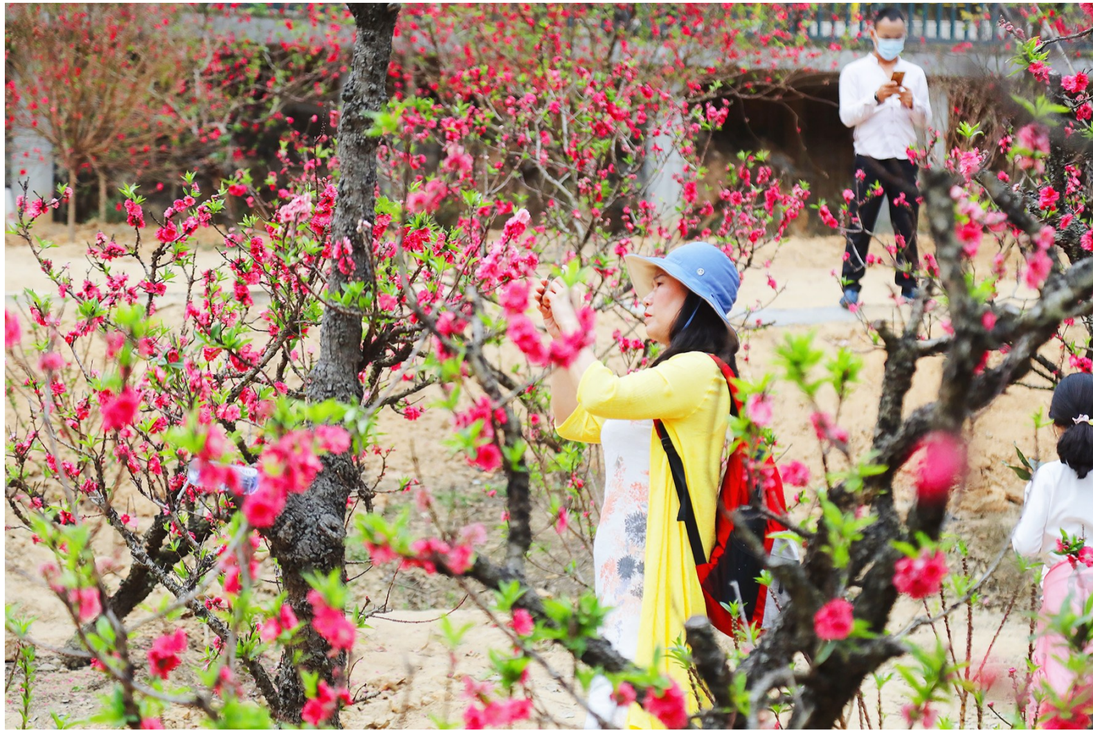
■南国桃园桃花谷的桃花开得灿烂,吸引市民观赏。

统筹/珠江时报记者 方智恒 文/珠江时报记者 刘贝娜