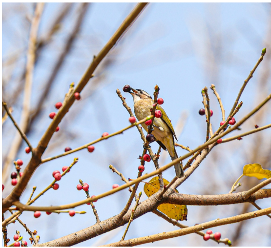
■映月湖公园,小鸟在枝头啄食树果。