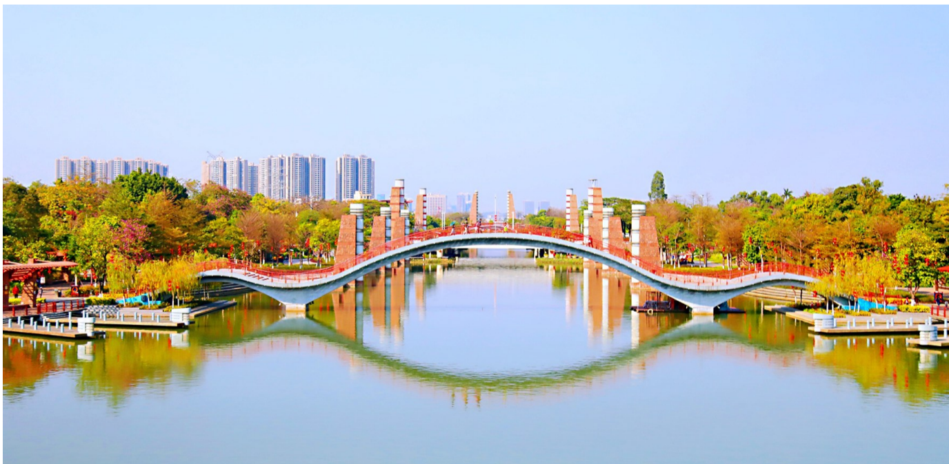
■千灯湖三期的红廊吊灯、栈道码头,构成一幅美丽画卷。