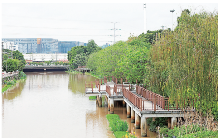
■整治后的谢边涌及大范河水系。

投标制度改革的首个试点项目,由中电建等五大央企联合体中标,具有里程碑意义。项目采用了EPC总承包模式,即含设计、采购、施工等的工程总承包模式。与传统的设计施工分离的建设模式相比,更强调和发挥设计作用,能有效地加强设计施工等各阶段建设工作的合理衔接和有机统一。