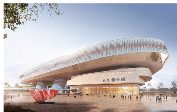
■建川新中国百年博物馆效果图。(资料图片)

建川新中国百年博物馆落户佛山西站枢纽新城的主要原因,这里是国内少有的集区位、交通、资源优势于一体的城市新区,且位于综合实力位列