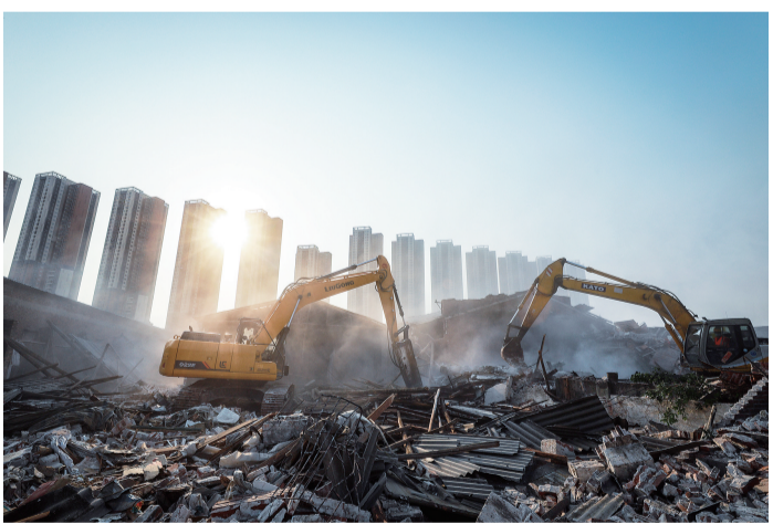
■大沥镇大沙工业区清拆现场。

村级工业园升级改造是南海区推进试验区建设,实现“一个提升、两个连片”高质量发展的“头号工程”。通过“大策划、大拆除、大建设、大投入”,截至12月11日,全区村级工业园共拆除整理3.67万亩,累计拆除整理6万亩,累计新建及在建产业载体1023.83万平