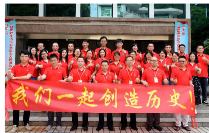
南海中学2020届高三班主任团队在新的起跑线上出发了。