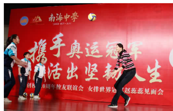
女排世界冠军赵蕊蕊与南海中学学子互动。