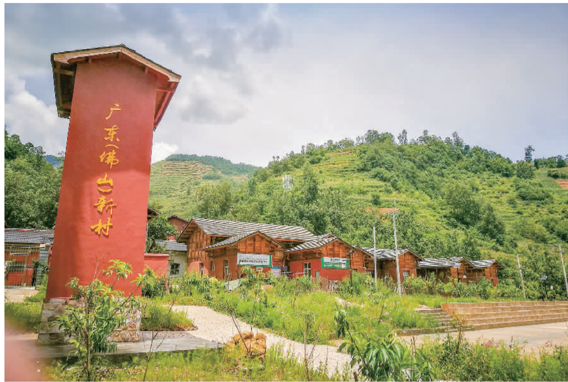
■环境优美的谷莫村。

千里结对一家亲，村村帮扶见真情。只要我们把责任担当在肩上，把行动落到脚下，佛山凉山携手打造全国东西部扶贫协作样板，把“穷亲戚”都变成“富乡亲”，就一定能够夺取脱贫攻坚战的全面胜利。