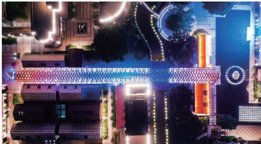
■千灯湖创投小镇金色长廊长度约118米,是小镇的标志性景观之一。