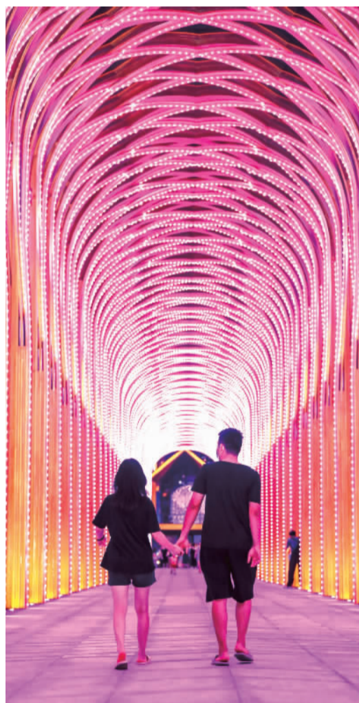
■情侣走在粉红色绚丽的长廊。

8月24日,在千灯湖创投小镇开园一周年之际,小镇举行了亮灯仪式,并且展示了小镇一年来的发展建设成果。在环境提升方面,自2019年开园以来,千灯湖创投小镇便在核心区实施改造及环境提升配套工程,从细微处入手,完善慢行系统、引进书店等生活配套硬件,令其宜业宜居宜享的创投氛围再上一层楼。