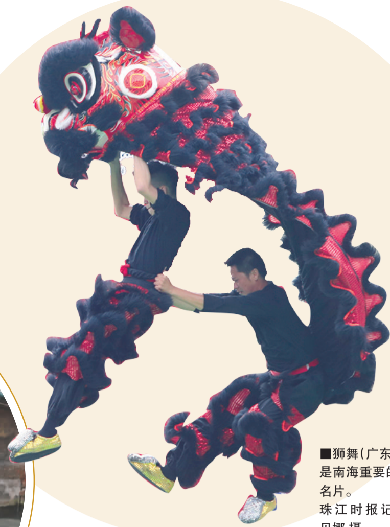
■狮舞(广东醒狮)是南海重要的非遗名片。