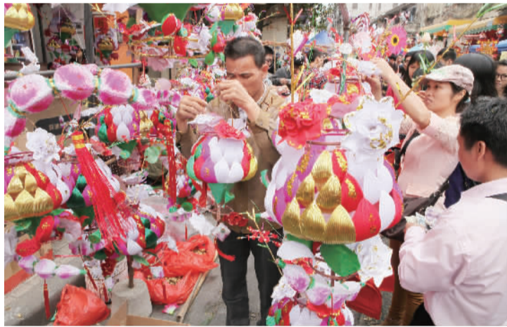
■罗村乐安花灯会是南海非遗代表之一。

近年来,南海区高度重视非遗的传承和文化产业的发展,通过民俗活动和文艺晚会,非遗进社区进学校等形式,让非遗传承人从“幕后”走向“台前”,走进群众的生活。官窑生菜会、大沥锦龙盛会、叠滘弯道赛龙舟、赤山跳火光习俗、松塘村孔子诞等传统民俗已成为南海的一张张特色文化名片,非遗在现代民众生活中的影响力日益增强。