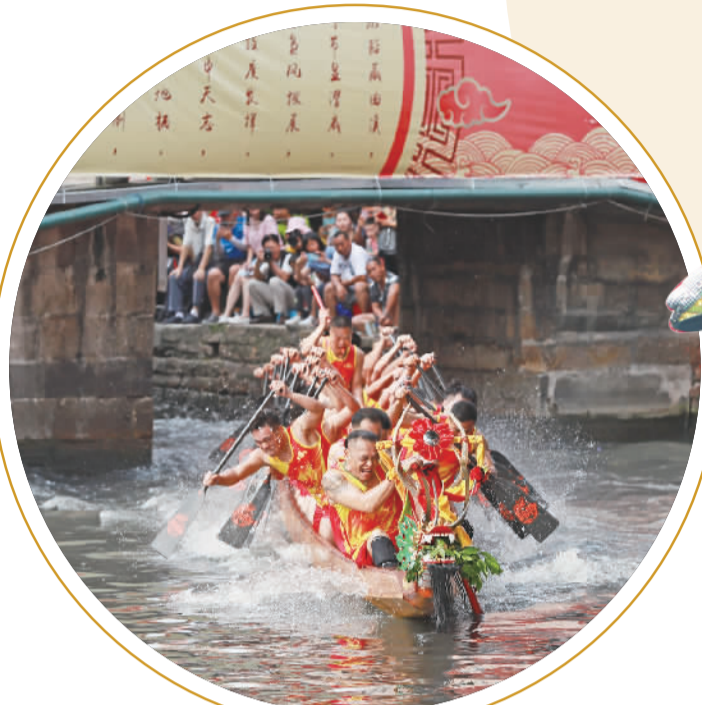
■叠滘弯道赛龙舟,是南海家喻户晓的民俗盛会。

佛山科学技术学院岭南文化研究院副教授、广东非遗研究基地主任谢中元长期关注南海非遗发展,他认为这个规划有着先行先试的意义。长远来说,对南海区域的非遗保护与发展起到支撑的作用。“南海非遗资源丰富,但项目的存续状态不均衡,此规划突出了分类化和精准化理念,有针对性地挖掘每个项目的存续状况,对其进行靶向化保护,补足短板。”