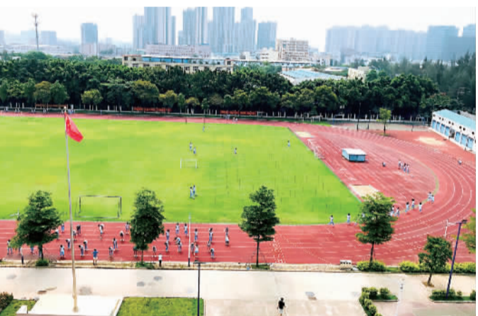
■映月中学标准运动场。

教学改革撬动学校变革，先进理念引领师生成长。近年来，映月中学正是凭借“练评讲”教育改革实现弯道超车，成为全国课改名校。2019年11月28日-30日，映月中学举办第二届“练评讲教育范式的发展研究”教育研讨会，来自全国各地的教育专家、教学名师600多人参加了此次研讨会。华南师范大学教育信息技术学院副院长、博士生导师谢幼如教授称赞“练评讲”是中国本土特色的“翻转课堂”。据悉，“练评讲”教育改革项目，获得广东省中小学教育创新奖，广东省